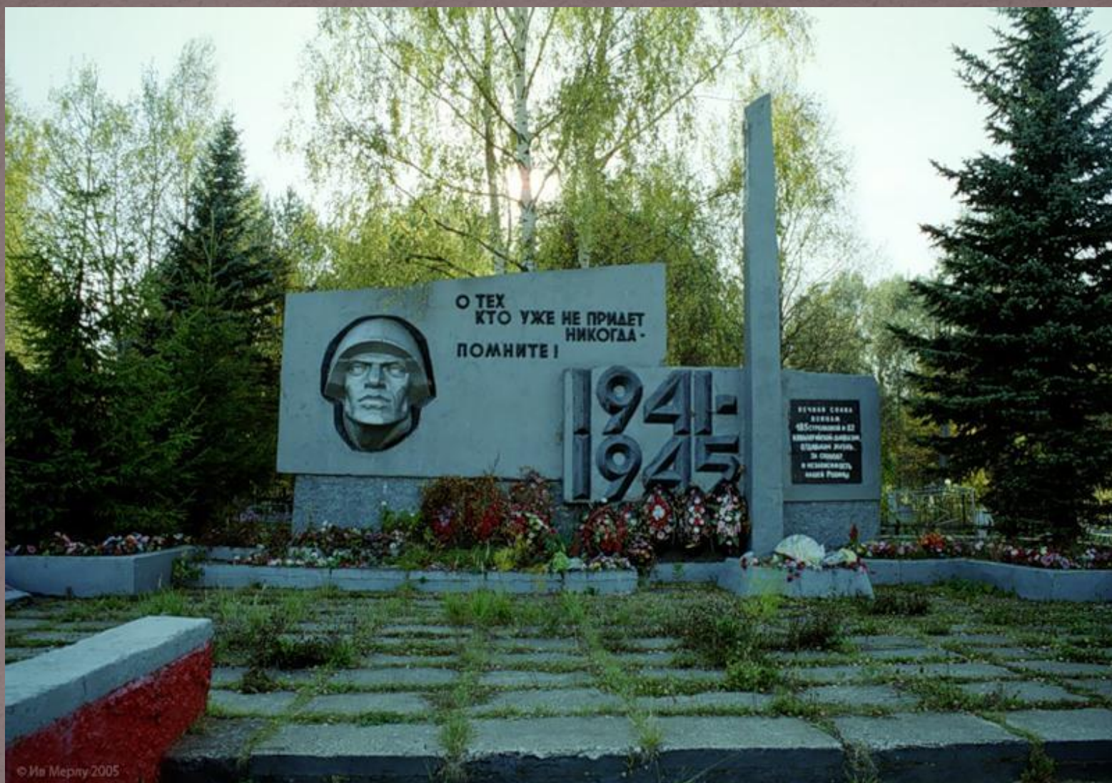
Мемориал в с. Селихово