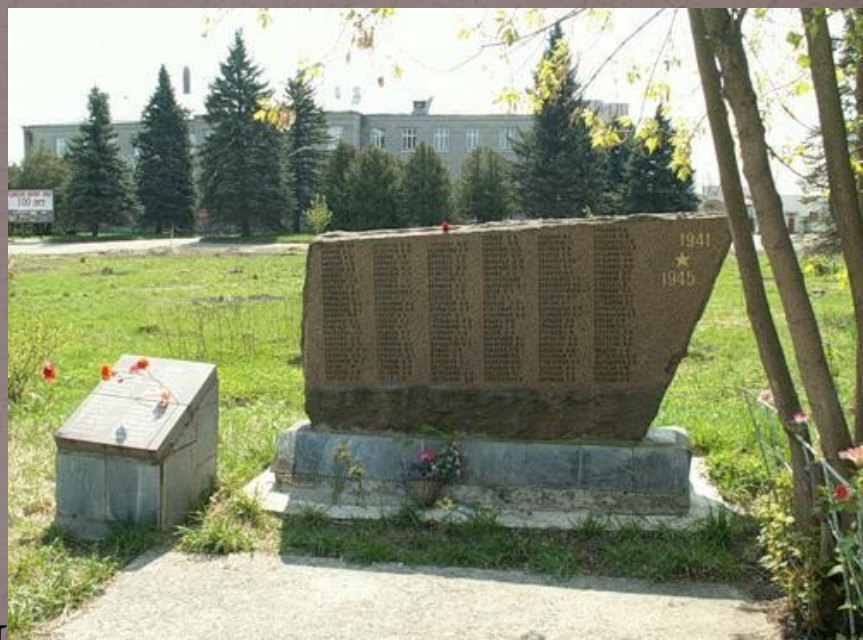
Памятники погибшим в годы ВОВ п. Редкино