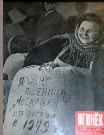
Фото из экспозиции Конаковского Краеведческого музея