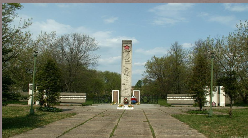
п. Озерки. Могила Героя Советского Союза А.С. Шаталкина, мемориал воинам и памятник неизвестному летчику.