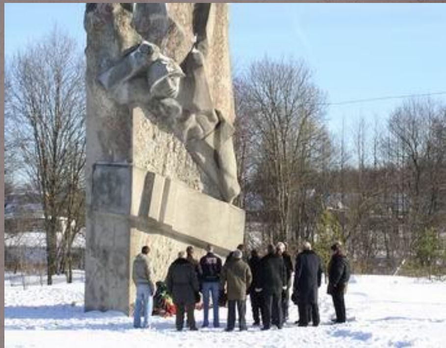
Памятник В. Васильковскому у д. Рябинки