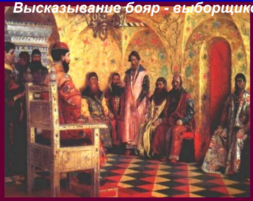
Высказывание бояр - выборщиков

«Миша Романов молод, разумом ещё не дошел и нам будет поваден».