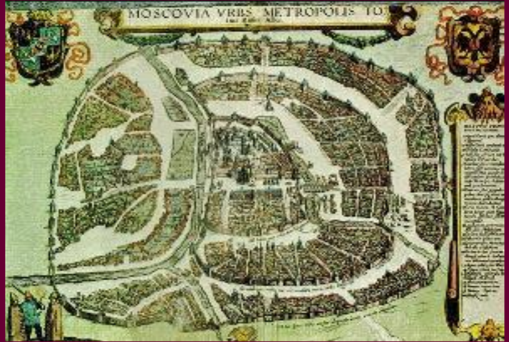
План Москвы 1610 г.

Поражение обострило противоречия. В это же время пришло известие о сдаче Смоленска из-за предательства. По инициативе Ляпунова был принят «Приговор всей земли», запрещающий казакам занимать дворянские должности, а 28 казаков были казнены. Остальные пригласили Ляпунова на круг и убили его. Ополчение распалось.