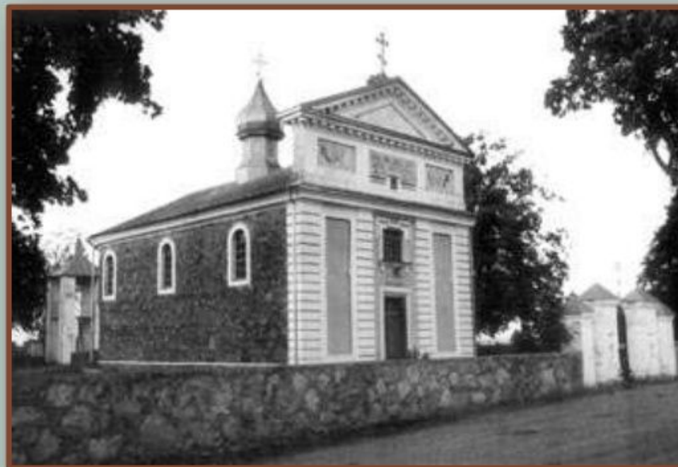
Униатская церковь святого Николая в д. Самуйловичи Дольные Мостовского района. Начало XIX в.

Иным было отношение к униатской церкви, униаты переводились в православие. В 1839 г. на Полоцком церковном соборе было принято решение о присоединении униатской церкви к православной. Господствующее положение в белорусских землях постепенно заняла православная церковь, получившая полную поддержку со стороны государства..