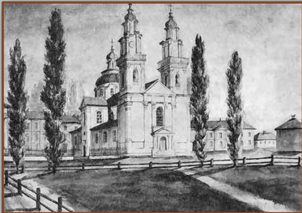
Костёл святого Стефана и монастырь иезуитов в Полоцке. Рисунок Н.Орды. XIX в.

При проведении конфессиональной политики первоначально учитывалась ситуация, сложившаяся на землях Беларуси к концу XVIII в., когда практически вся ополяченная местная шляхта и магнаты являлись католиками. Российские власти не мешали деятельности католической церкви до восстания 1830-1831 гг., в котором они приняли активное участие, и вместе с тем рассматривали православие в качестве одного из главных средств усиления своего влияния в крае.