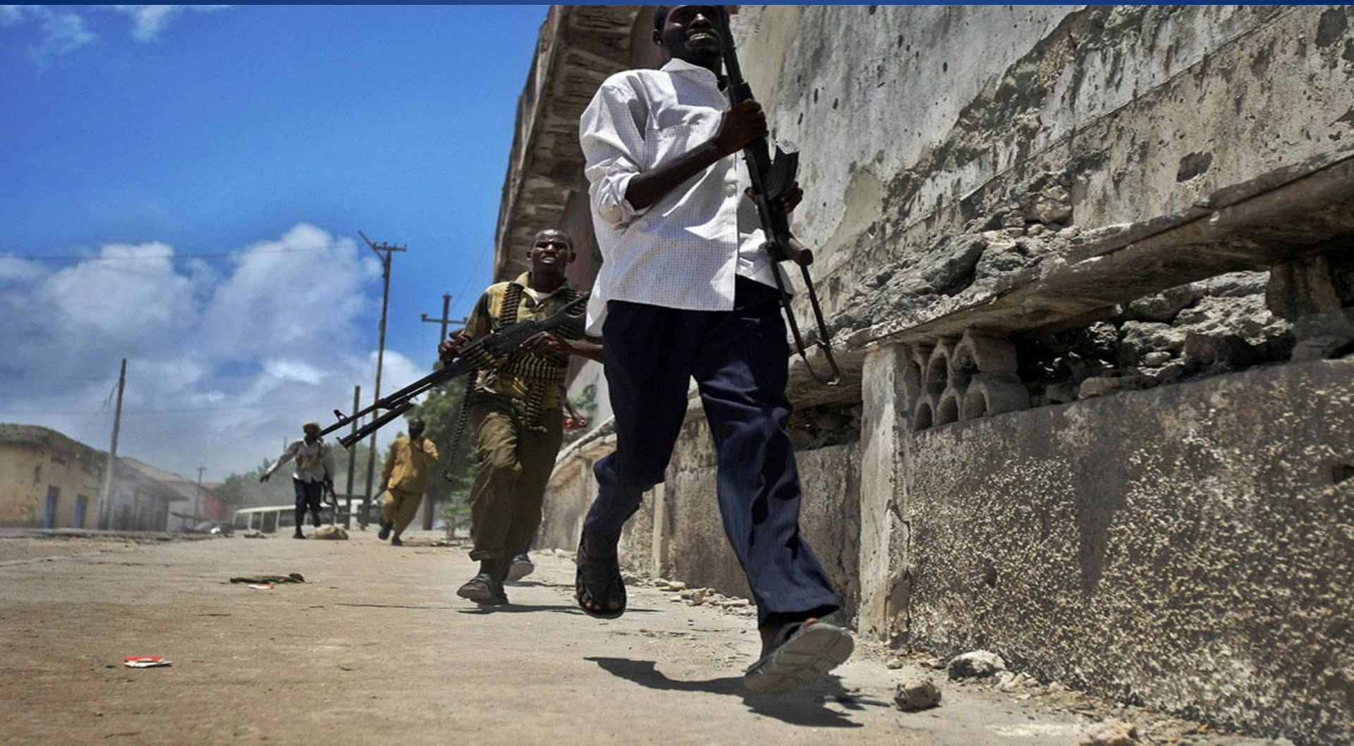
Фото сделано во время перестрелки с правительственными войсками в Могадишо (столица Сомали, крупнейший город и главный порт страны) 30 марта 2009 года.

Боевые действия велись с попеременным успехом. Несмотря на все усилия боевиков Аш-Шабааб, они не смогли захватить Могадишо, хотя вся территория к западу от столицы Сомали была под их усиленным контролем.