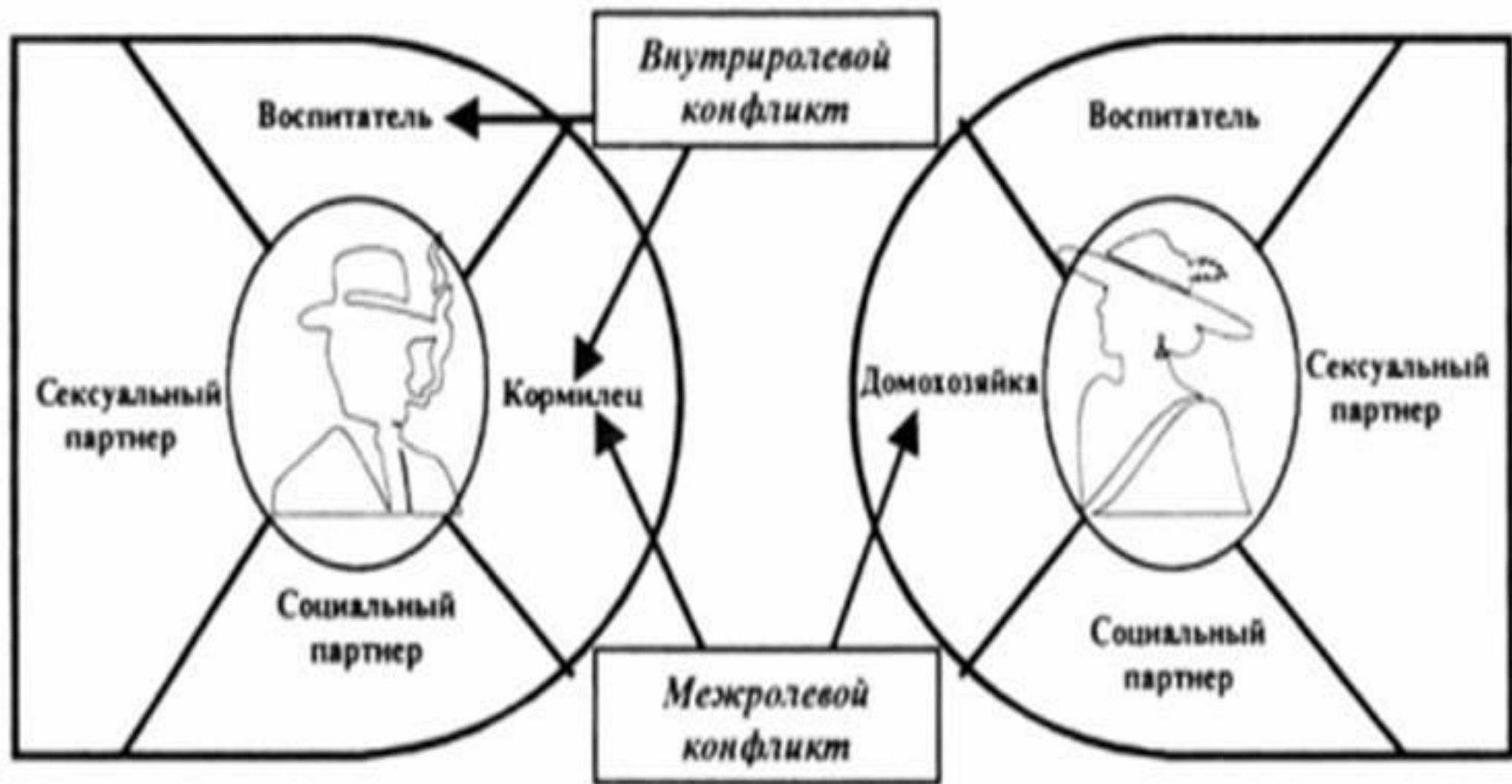
Рис. 5.4. Два вида ролевых конфликтов в статусной структуре семьи