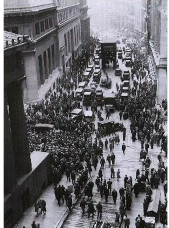
Толпа людей возле Нью-Йоркской фондовой биржи после финансового краха в 1929 г.