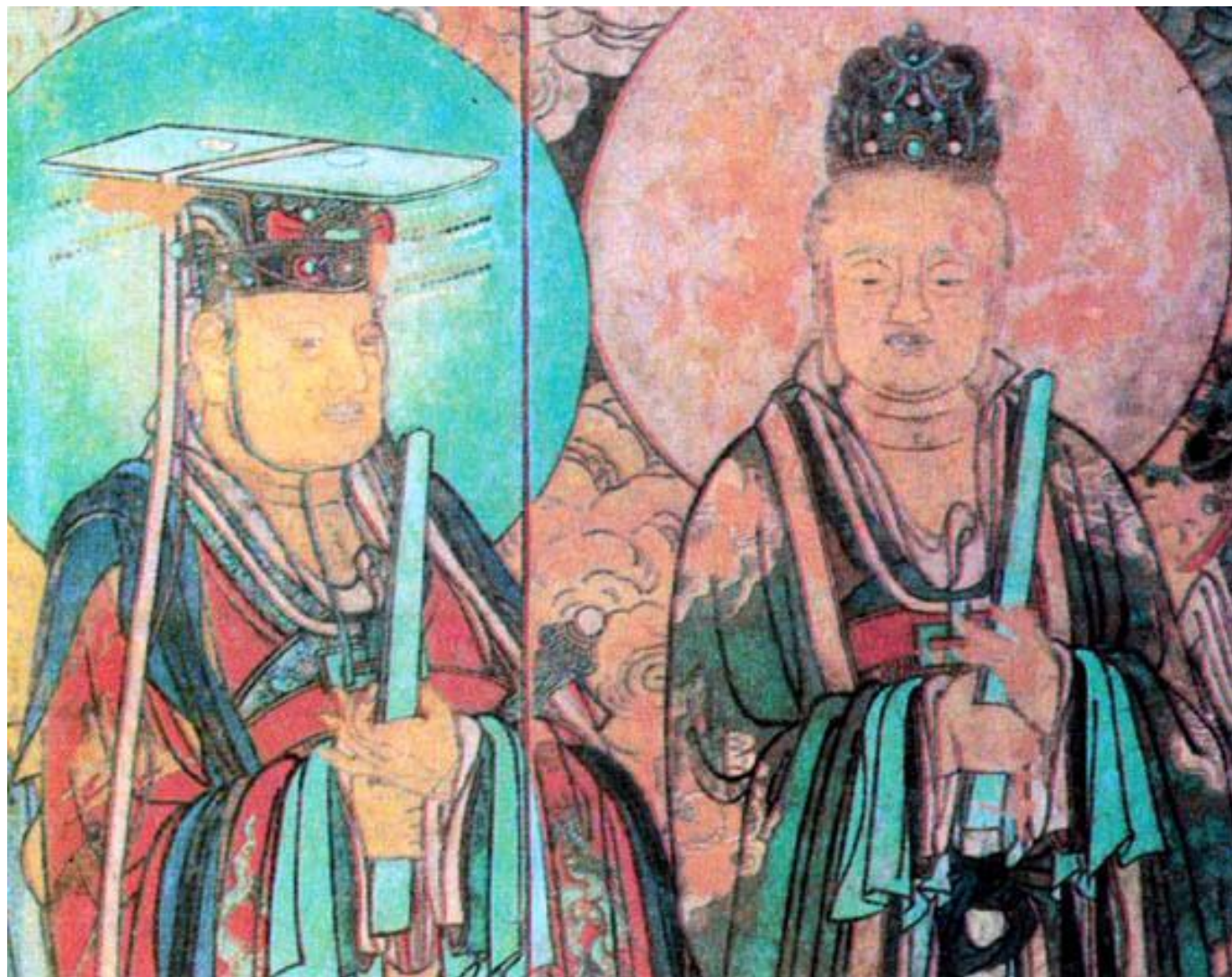
Портрет Лао-цзы (справа). Фреска. 1260-1368 гг.