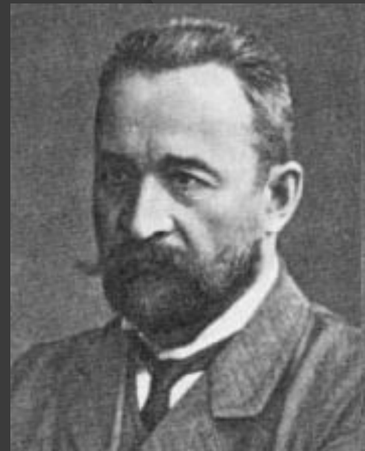
Князь Георгий Евгеньевич Львов