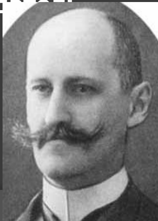
Фёдор Александр- рович Головин