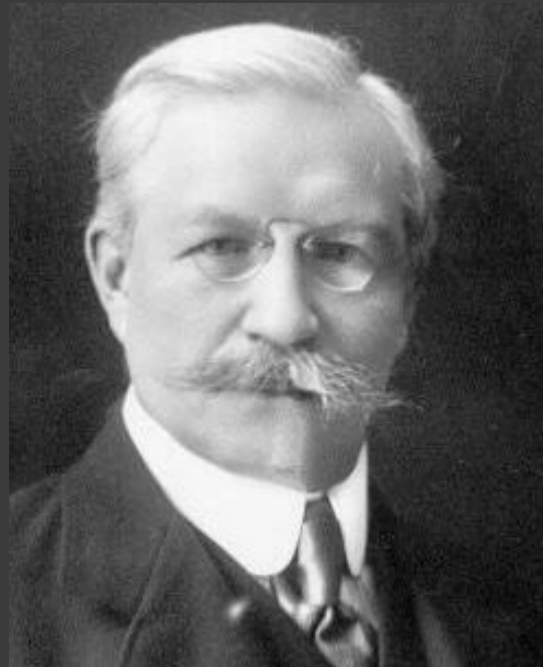
Павел Николаевич Милюков , председатель