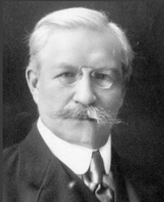
Павел Николаевич Милюков , председатель