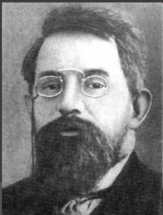
Пётр Бернгар- дович Струве