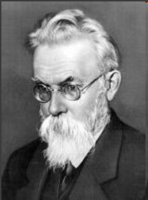
Владимир Иванович Вернадский