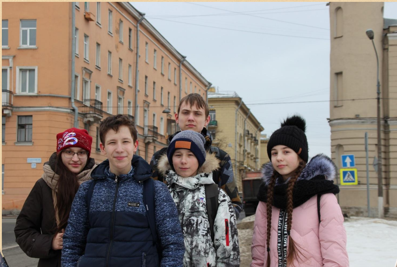
г. Санкт-Петербург 2018 года