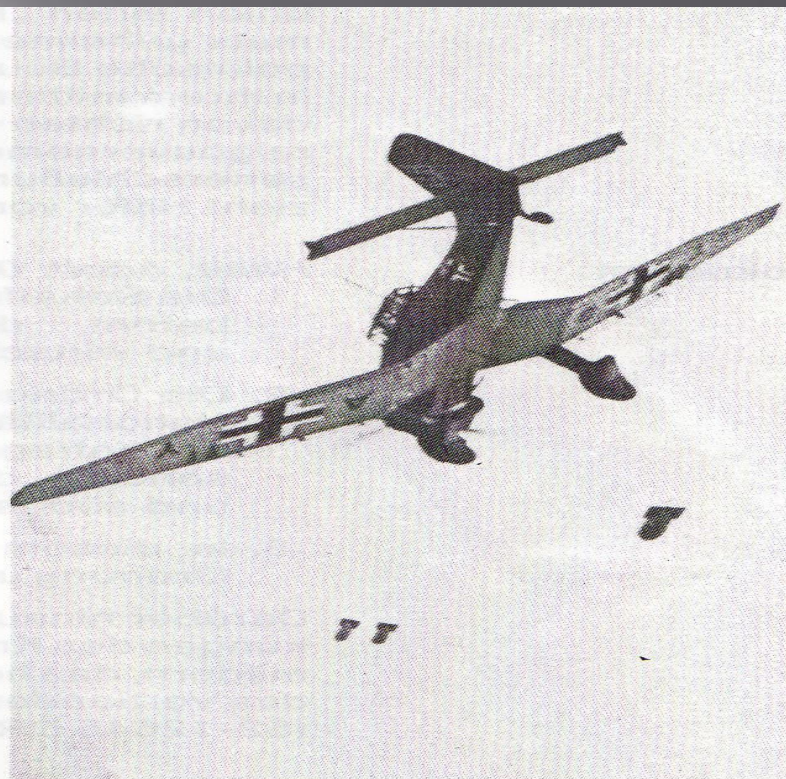
Angriff auf Polen