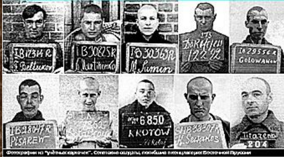
Фотографии из "ундваскартиски". Советские солдаты, погибшие в концлагере Восточный Пруссия

Крупнейшим лагерем был - Шталаг-1-А - располагавшийся в нынешнем посёлке Фурманово Багратионовского района. В 1939 году он был построен на месте бывшего полигона. До середины 1940 года в нём содержались только польские военнопленные, затем туда доставили французов и бельгийцев.