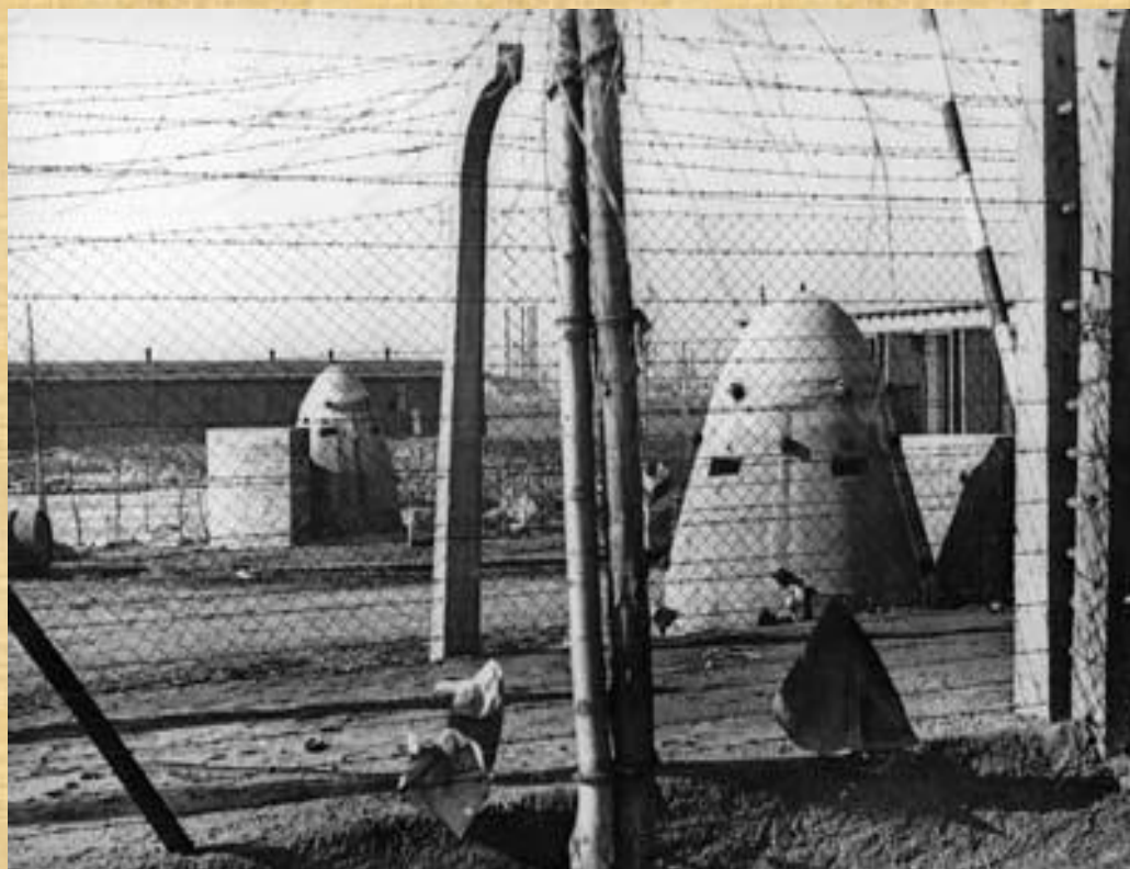
Бронекалпаки против умирающих узников. Освенцим.