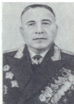
КОМАНДУЮЩИЙ ПЕРВОЙ ГВАРДЕЙСКОЙ ТАНКОВОЙ АРМИЕЙ М.Е. КАТУКОВ