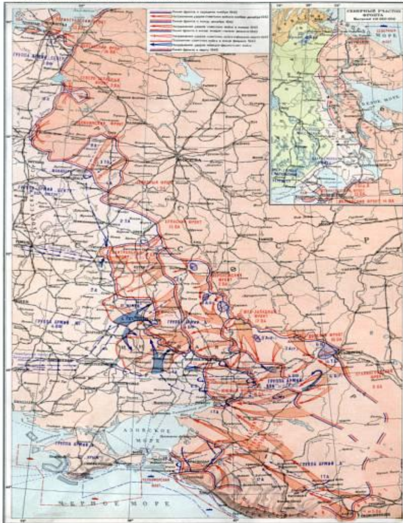
ОБЩИЙ ХОД ВОЕННЫХ ДЕЙСТВИЙ В ЗИМНЕЙ КАМПАНИИ 1942-1943 ГГ.