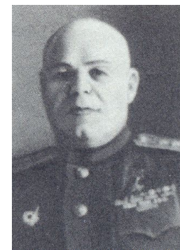
КОМАНДУЮЩИЙ ТРЕТЬЕЙ ГВАРДЕЙСКОЙ ТАНКОВОЙ АРМИЕЙ П.С. РЫБАЛКО