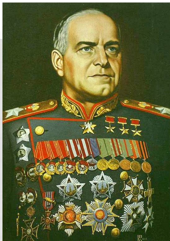
Георгий Константинович Жуков и Александр Михайлович Василевский - «Преднамеренная оборона»