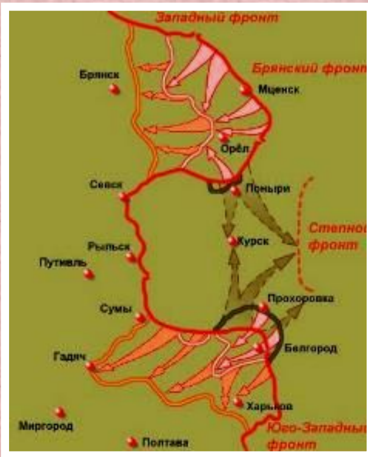
Битва на Курской Дуге.

Эти поражения обескровили немецкую армию, но Гитлер жаждал реванша. Он провел мобилизацию и направил на фронт 2 млн. солдат. На вооружение немцев были поставлены танки «Тигр» и «Пантера» , штурмовые орудия «Фердинанд» . Немецкое руководство намеревалось «срезать» Курскую дугу и взять реванш за Сталинград. По предложению Жукова Красная Армия перешла к преднамеренной обороне. К этому времени она получила новые танки Т-34 .