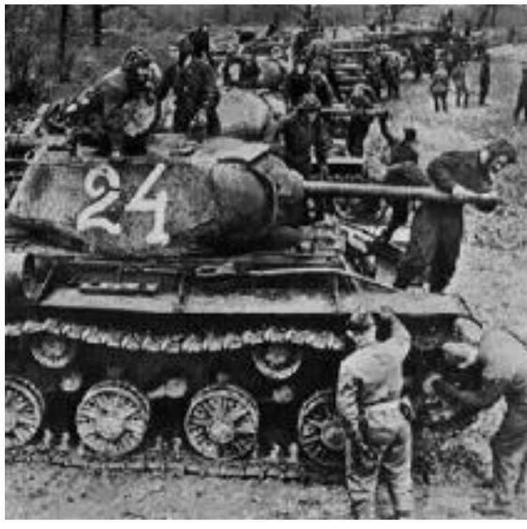
Советские танки Перед Курской битвой

12 июля советские войска перешли в наступление Под д.Прохоровка разгорелось крупнейшее в истории танковое сражение (1200 машин). Этот день стал переломным в ходе битвы. В течение месяца были освобождены Харьков, Орел, Белгород. Германия потеряла 500000 солдат, 1500 танков, 3700 самолетов. В сентябре 1943 г. началась битва за Днепр, и 6 ноября Красная Армия освободила Киев.