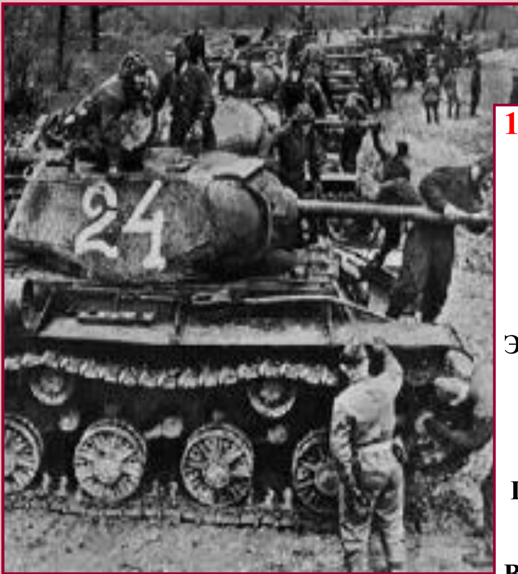
Советские танки перед Курской битвой

12 июля советские войска перешли в наступление под д.Прохоровка разгорелось крупнейшее в истории танковое сражение(1200 машин).