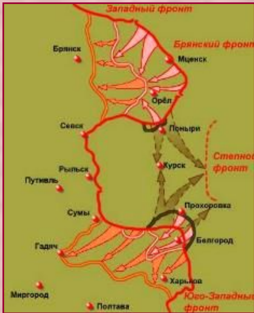
Битва на Курской Дуге.

Гитлер жаждал реванша. Он провел мобилизацию и направил на фронт 2 млн. солдат. На вооружение немцев были поставлены танки «Тигр» и «Пантера», штурмовые орудия «Фердинанд». Немецкое руководство намеревалось «срезать» Курскую дугу и взять реванш за Сталинград. Немецкая операция получила название «Цитадель» . По предложению Жукова Красная Армия перешла к преднамеренной обороне.