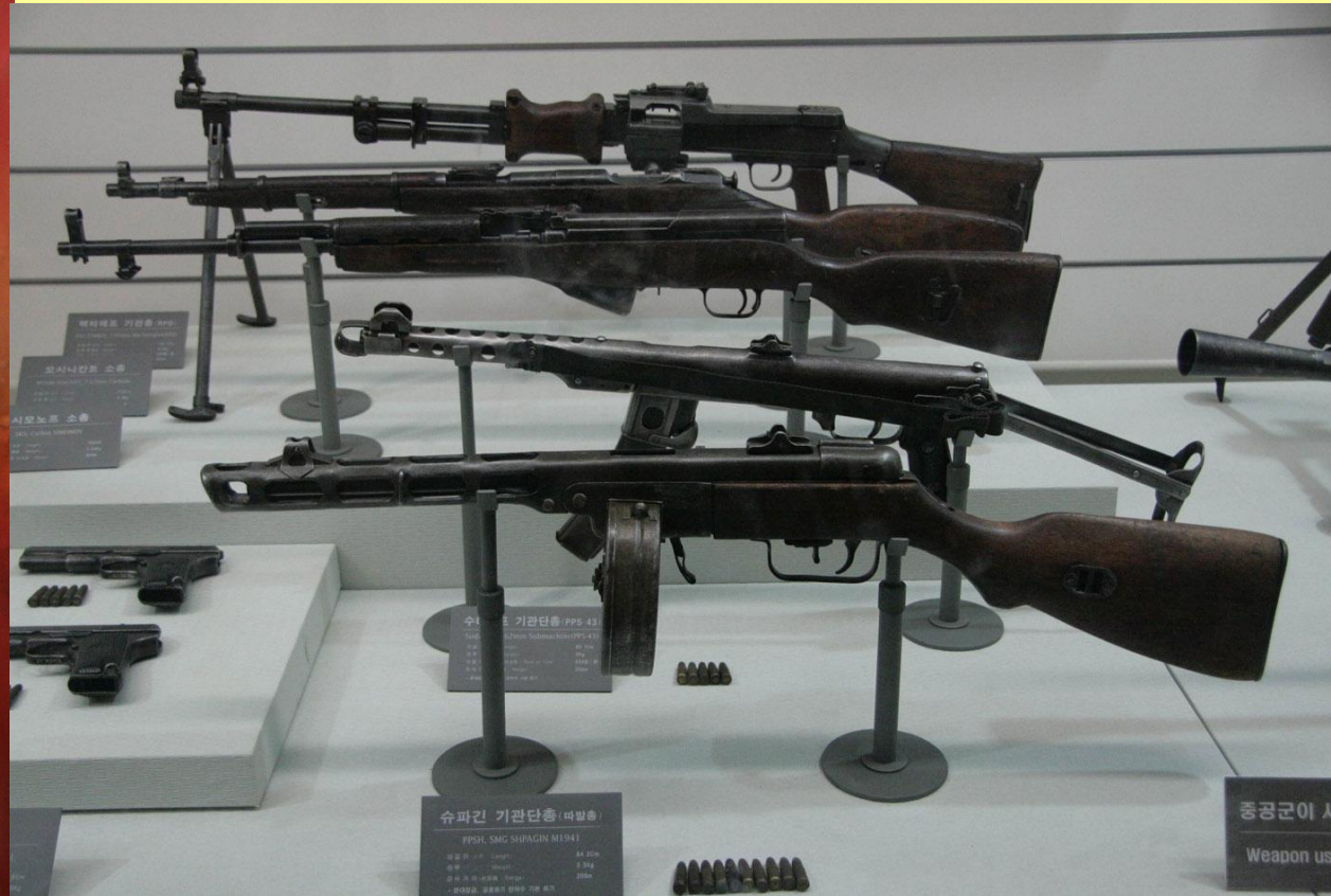
Трофейное оружие советского производства, захваченное у китайских войск в Корее.