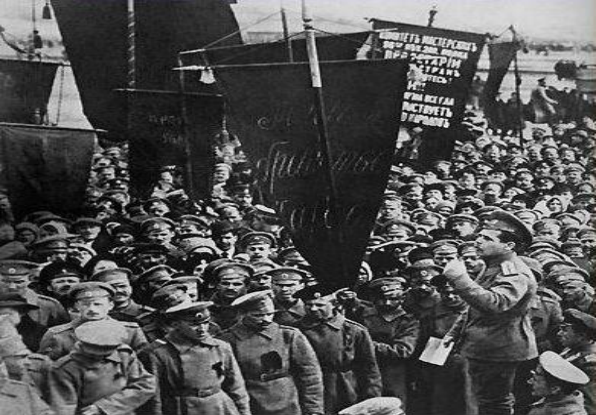
Митинг революционных солдат 56-го пехотного полка на Ходынском Поле. Москва, апрель 1917 г.