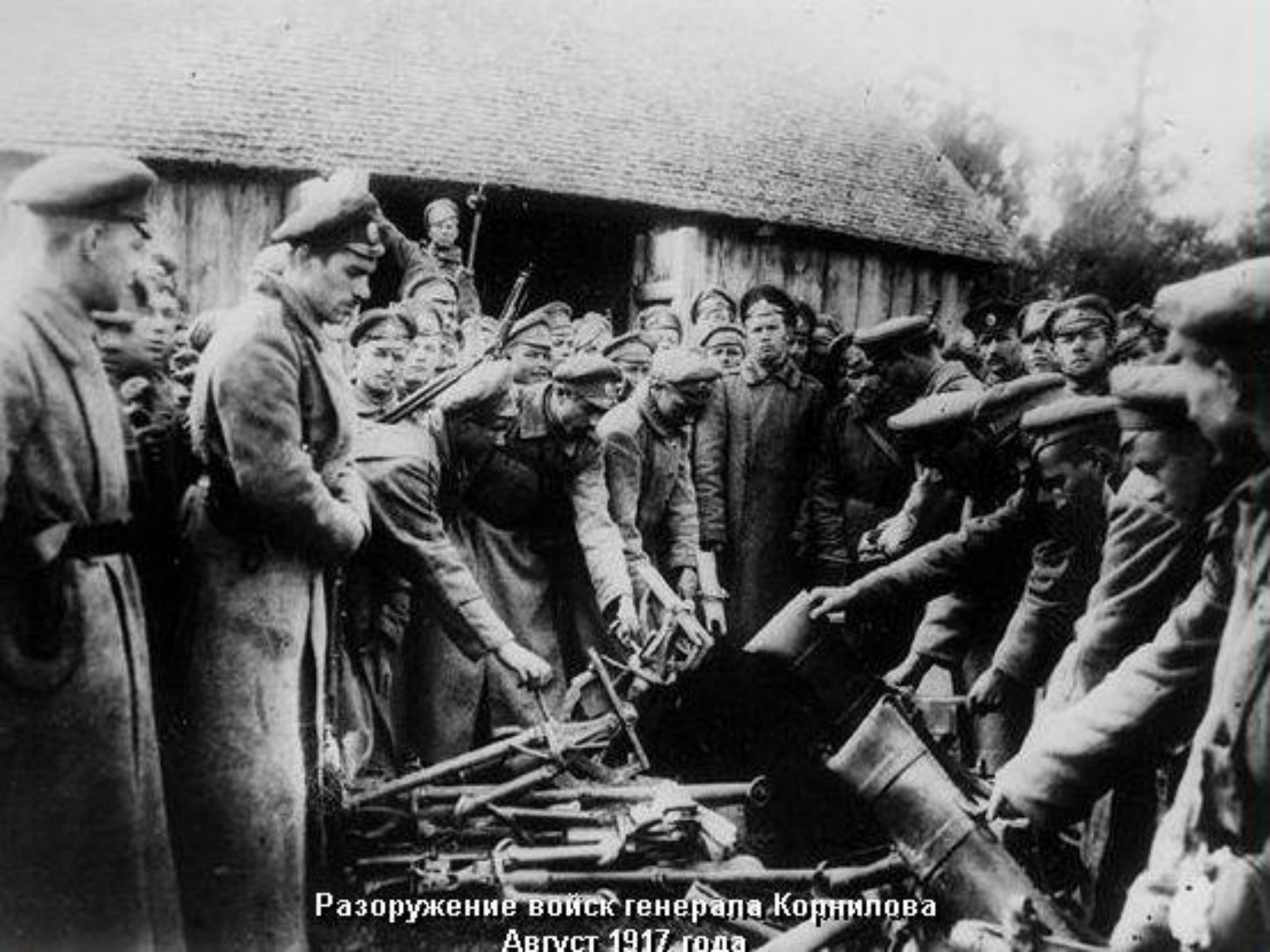
Разоружение войск генерала Корнилова Август 1917 года