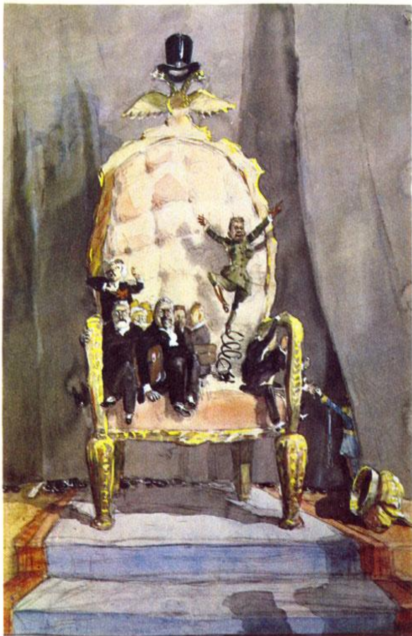
Временное правительство, 1940