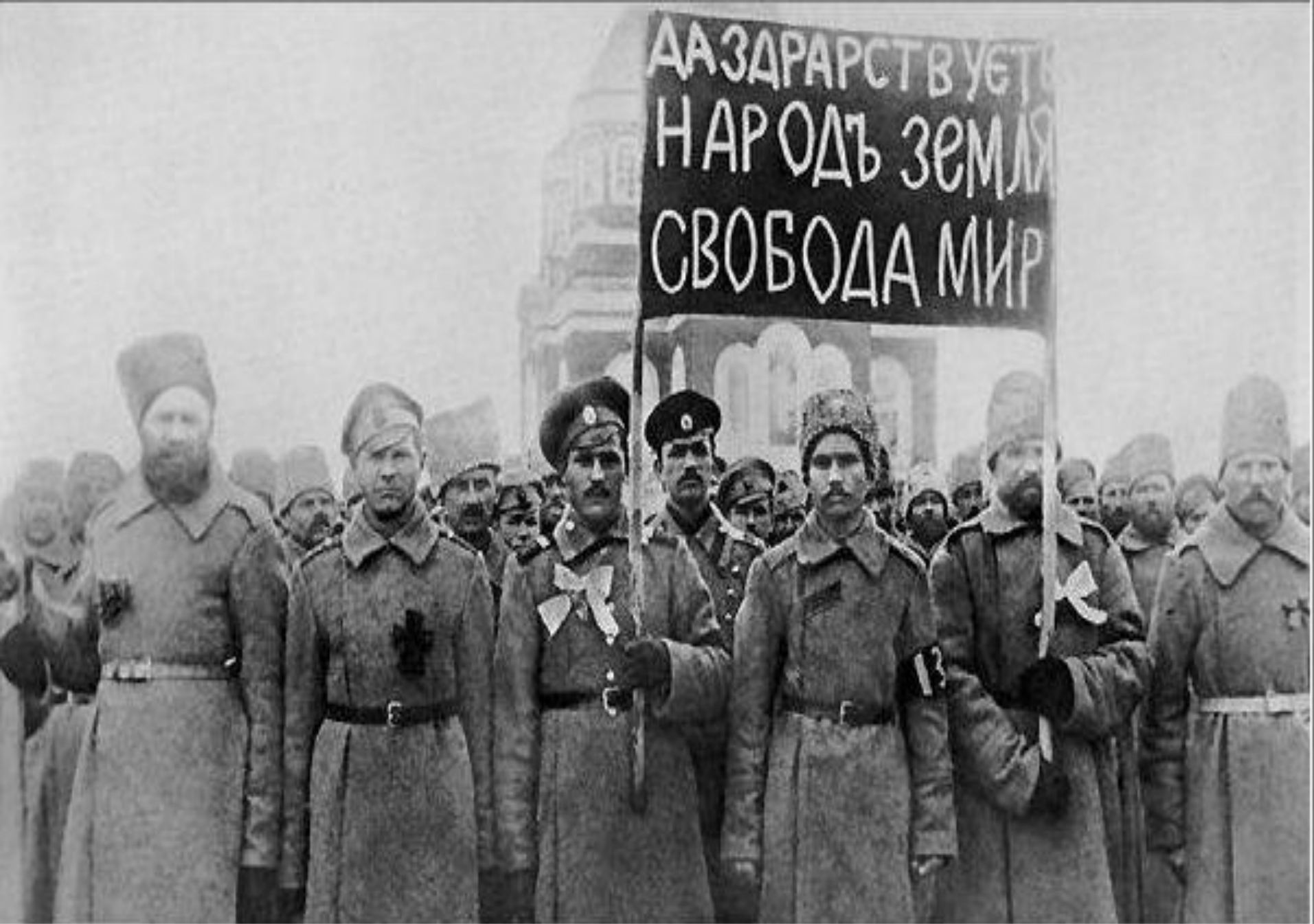
Демонстрация солдат в поддержку революции