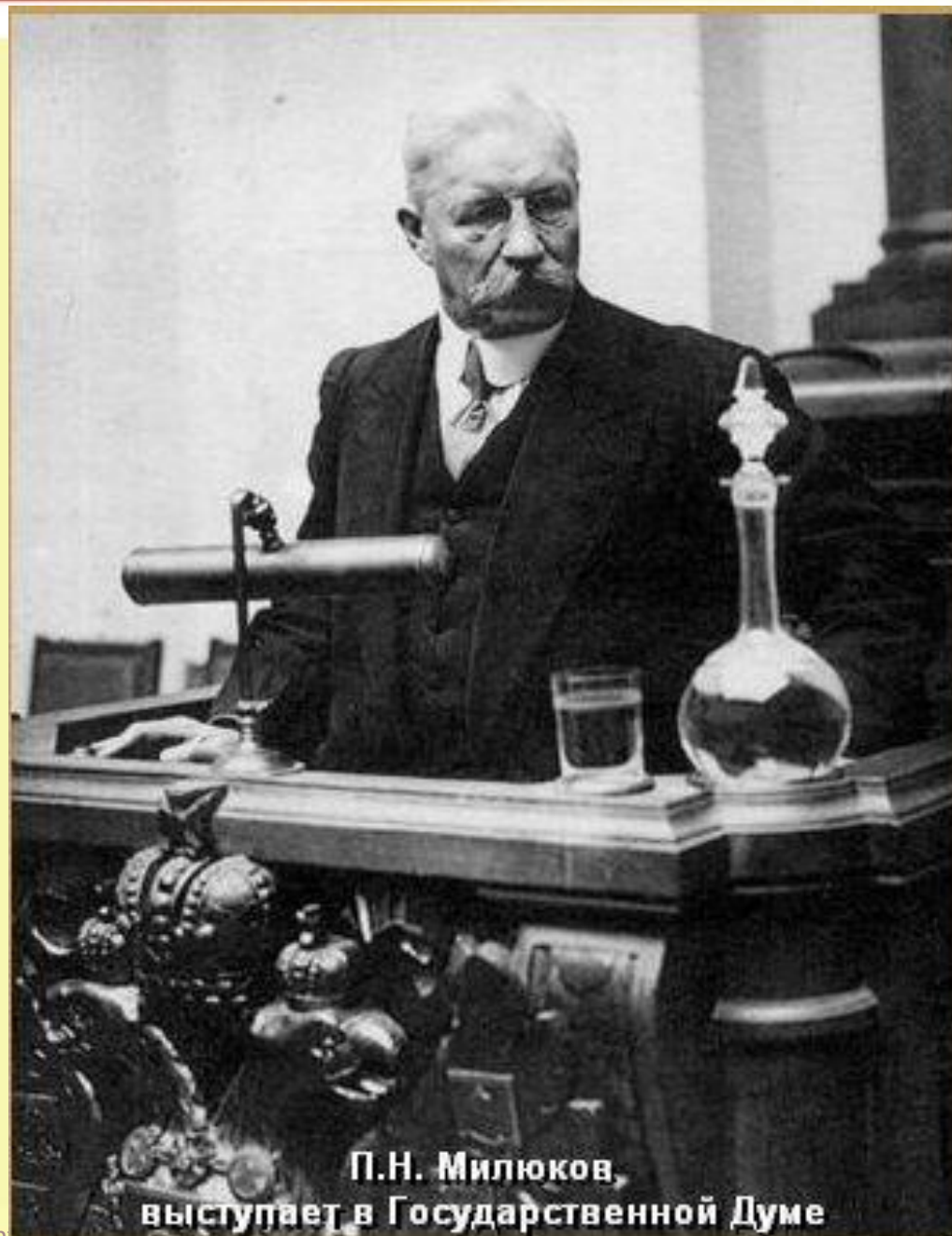
П.Н. Милюков, выступает в Государственной Думе

18 апреля прозвучало заявление Милюкова о «ведении войны до победного конца». В ответ по всей стране прошли антивоенные демонстрации. Лозунги: «Долой войну!»»