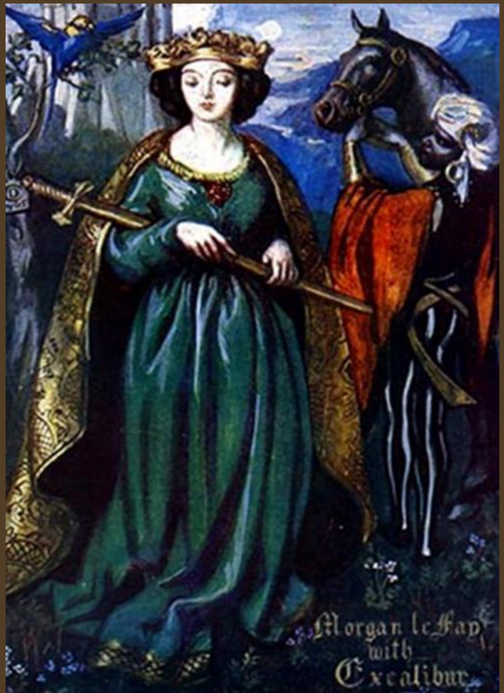
Morgan le Fay with Excalibur