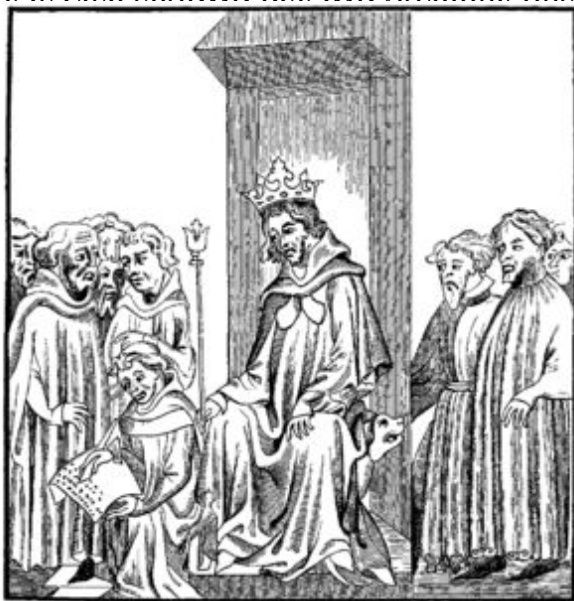
Fig. 7.—The King of the Franks, in the midst of the Military Chiefs who formed his Treuve , or armed Court, dictates the Salic Law (Code of the Barbaric Laws).—Fac-simile of a Miniature in the "Chronicles of St. Denis," a Manuscript of the Fourteenth Century (Library of the Arsenal).

Король касался своими руками бедняк нездорового, крестил е му слова.