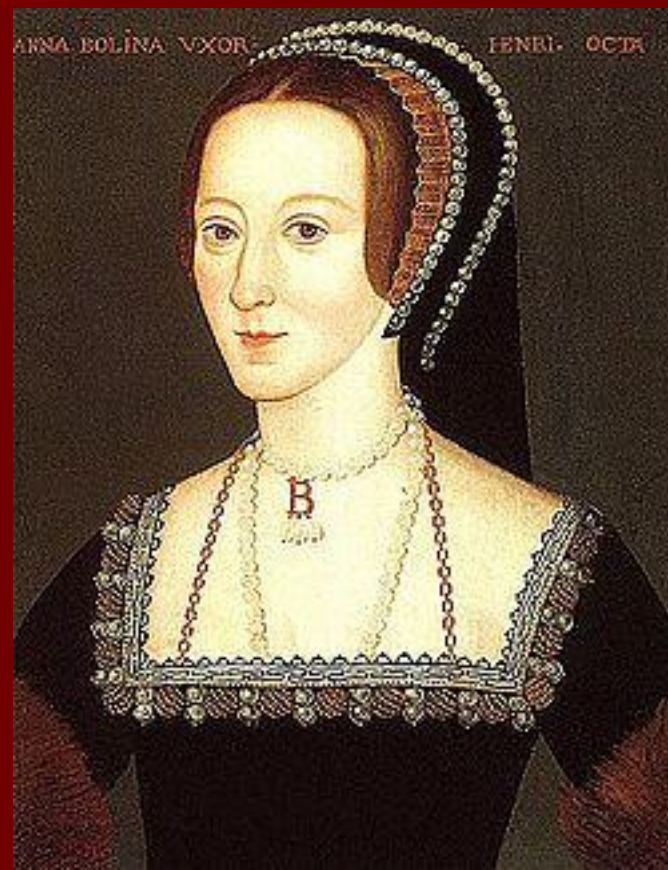
2 - Анна Болейн