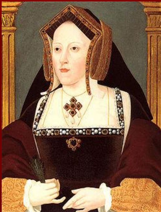
1 - Екатерина Арагонская