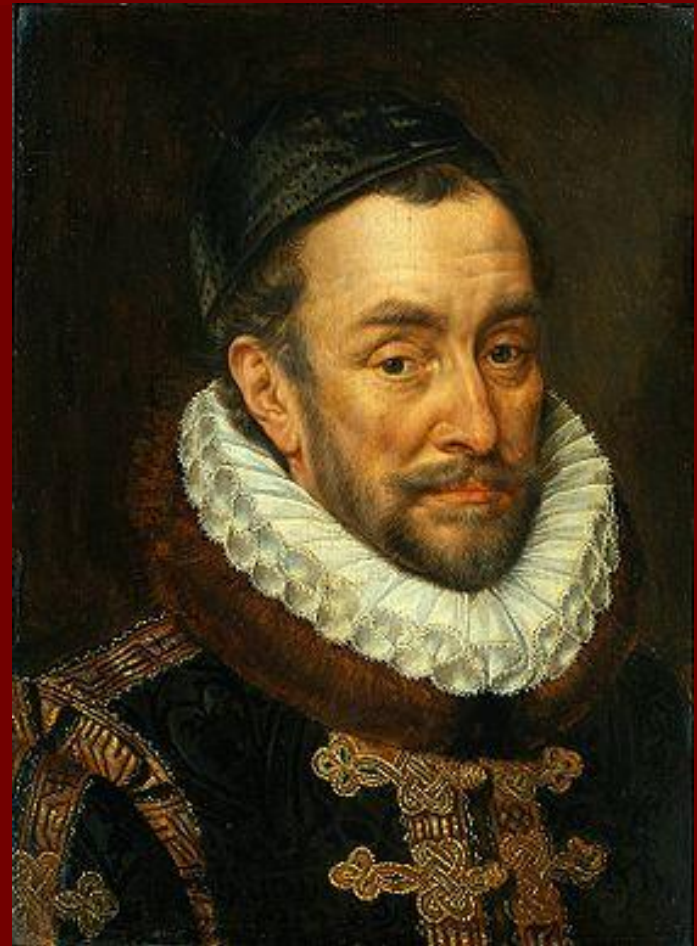
Вильгельм I Оранский