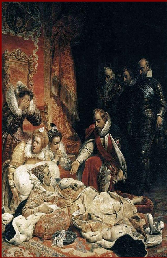
Смерть королевы Елизаветы

После победы над Непобедимой армадой моряков уволили с кораблей не заплатив. Были приняты жестокие законы против нищих и бродяг.