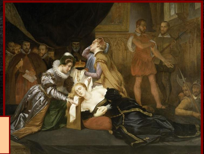
Казнь Марии Стюарт