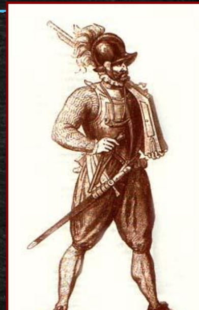
Испанские солдаты 16 века

Король католической Испании Филипп II с опасением следил за усилением протестантской Англии. Англия помогала борьбе Нидерландов против Испании, а Филипп II содействовал всем заговорам против королевы Елизаветы.