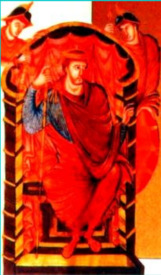
Карл Мартелл. Средневековая миниатюра

В 732 г. Мартелл разбил у г. Пуатье арабов завоевавших Испанию.