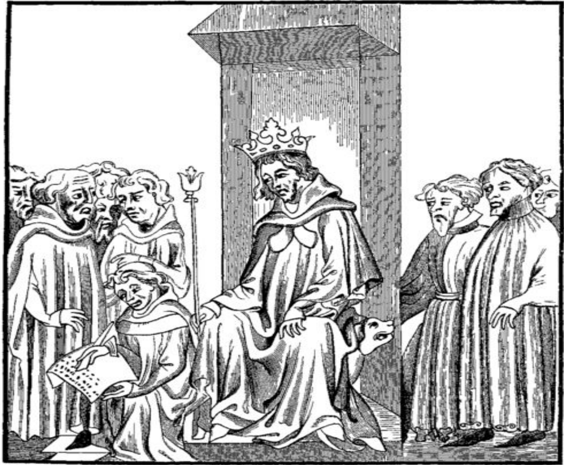
Fig. 7.—The King of the Franks, in the midst of the Military Chiefs who formed his Treuste , or armed Court, dictates the Salic Law (Code of the Barbaric Laws).—Fac-simile of a Miniature in the “Chronicles of St. Denis,” a Manuscript of the Fourteenth Century (Library of the Arsenal).