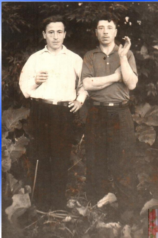
Владимир Федорович с братом