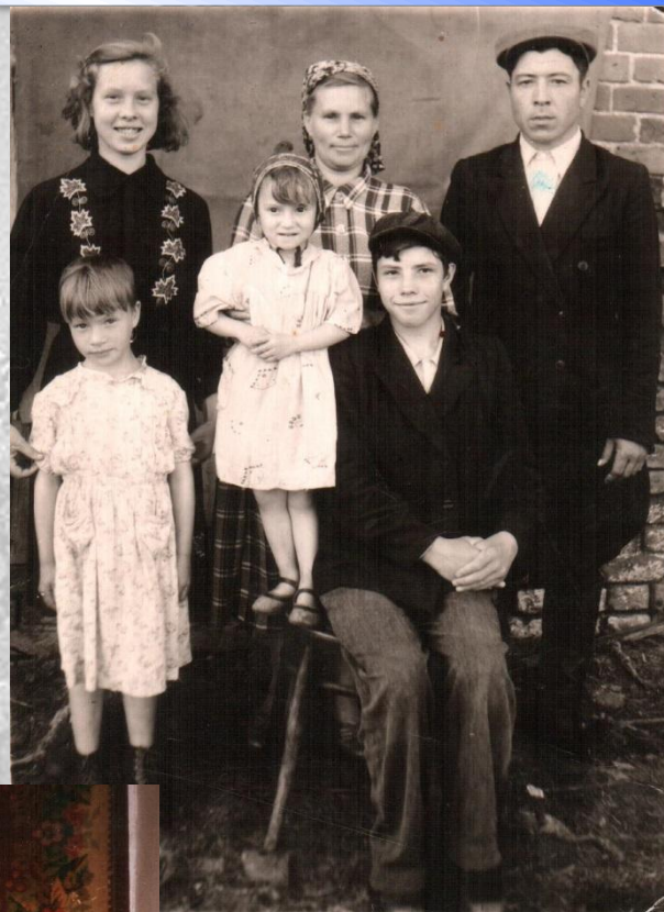
С женой и детьми