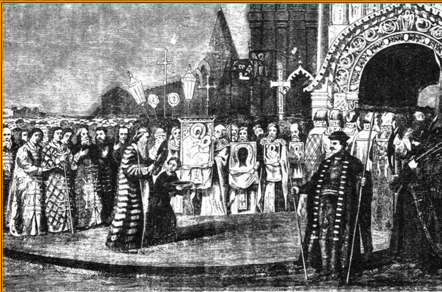
Шествіє царя Михаила Феодоровича на коронованіє.

Так в России закончилось «Смутное время»