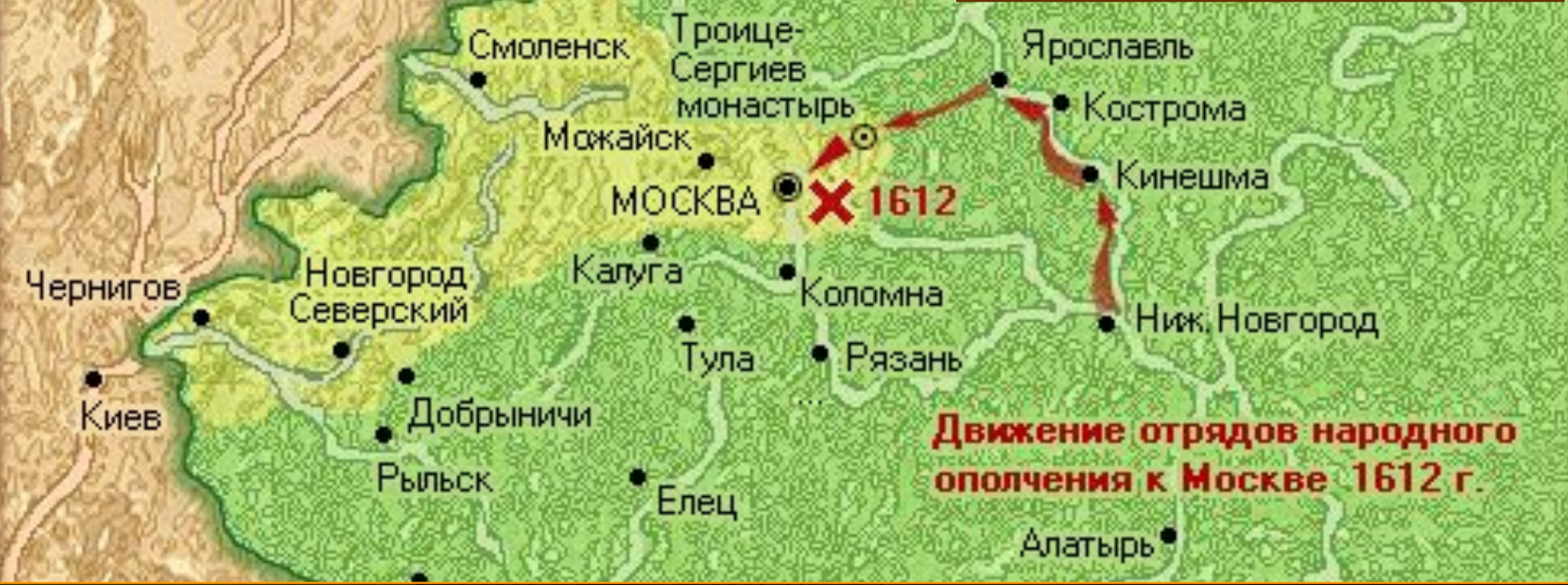
Костромичи в составе народного ополчения дошли до Москвы