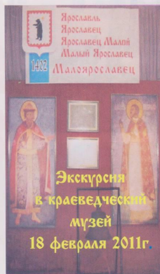
Экскурсия в краеведческий музей 18 февраля 2011г.