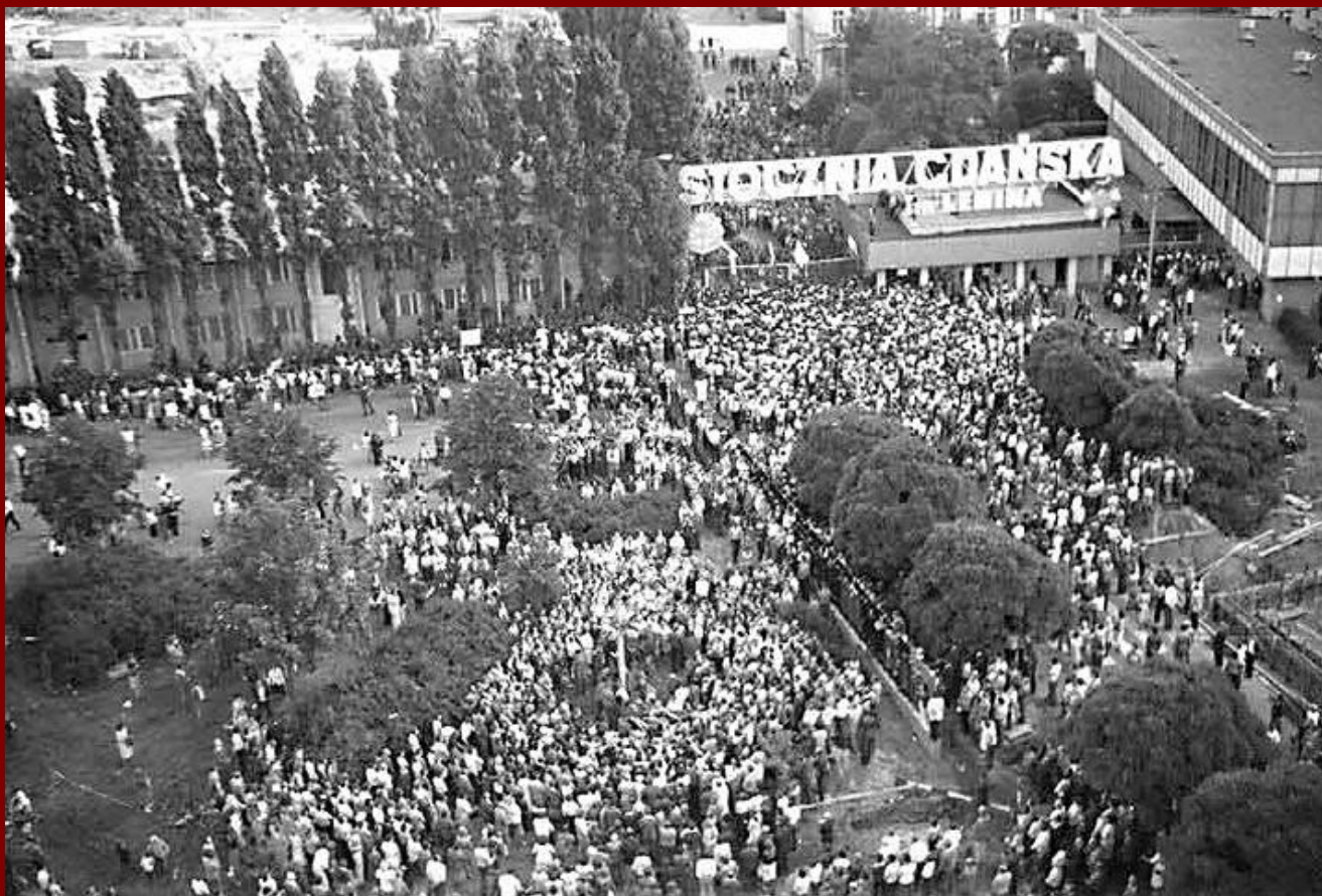
Забастовка, организованная Лехом Валенсой Судоверфь имени В.И. Ленина в г. Гданьск (Польша). 1970-начало – 1980-х гг.