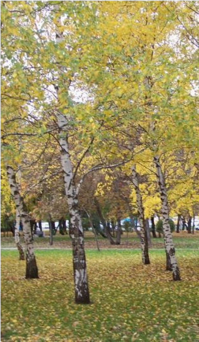
светлые (мелколиственные береза, осина),

В XIX веке российские леса в зависимости от видового состава деревьев классифицировались следующим образом: