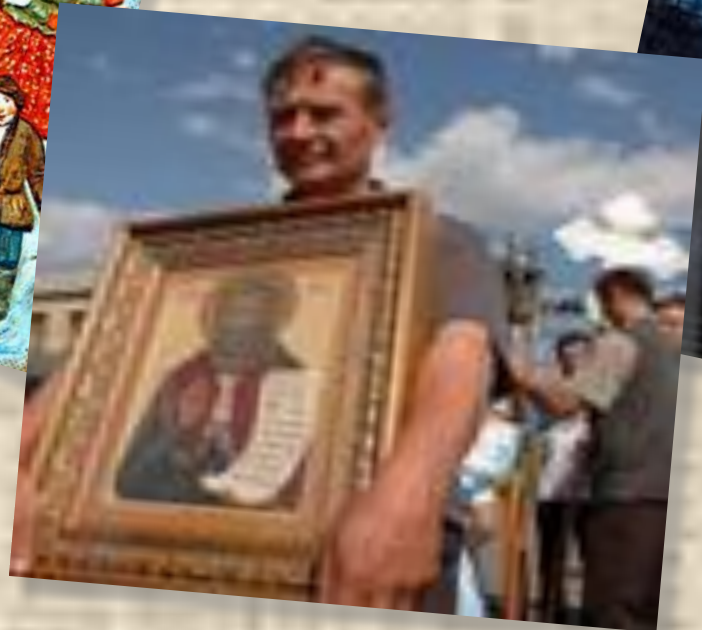
Половине православных Церквей священной почитаются Илья Пророк