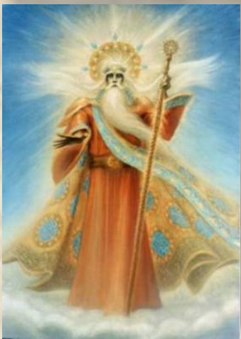
бог Солнца - Ярило