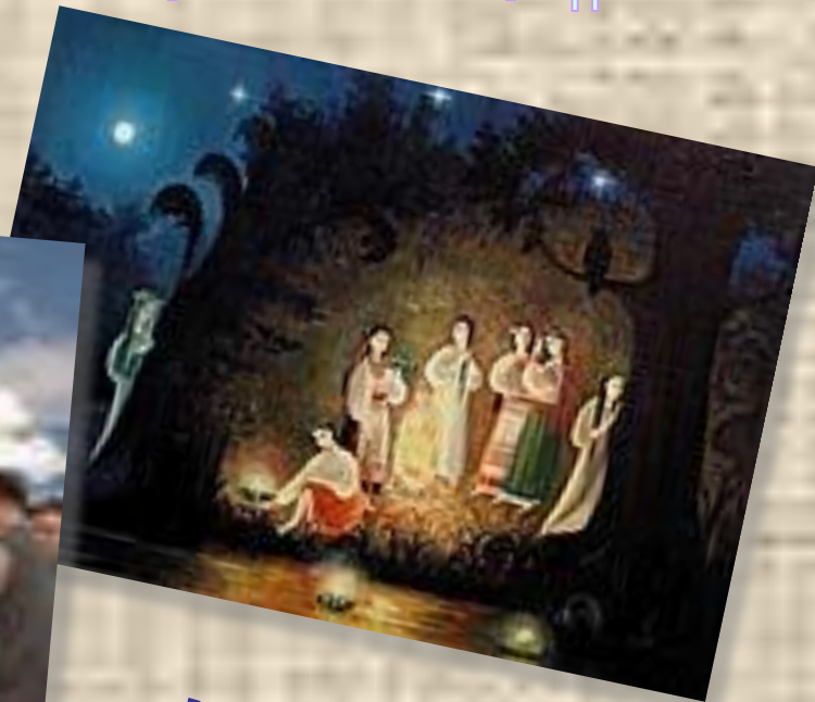
Половине православных церквей священной почитаются Илья Пророк