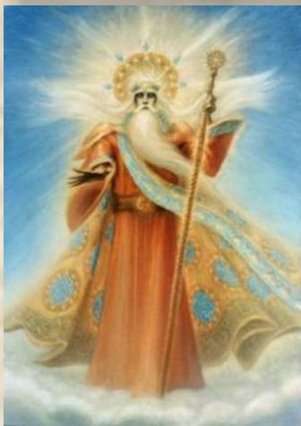
бог Солнца - Ярило