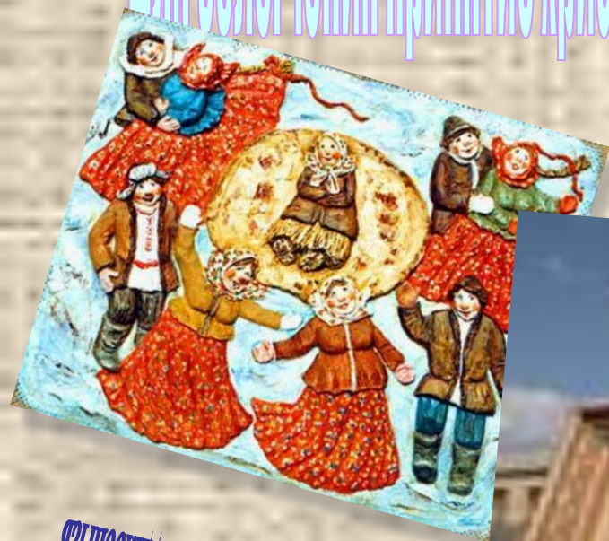
языческим является праздник масленицы