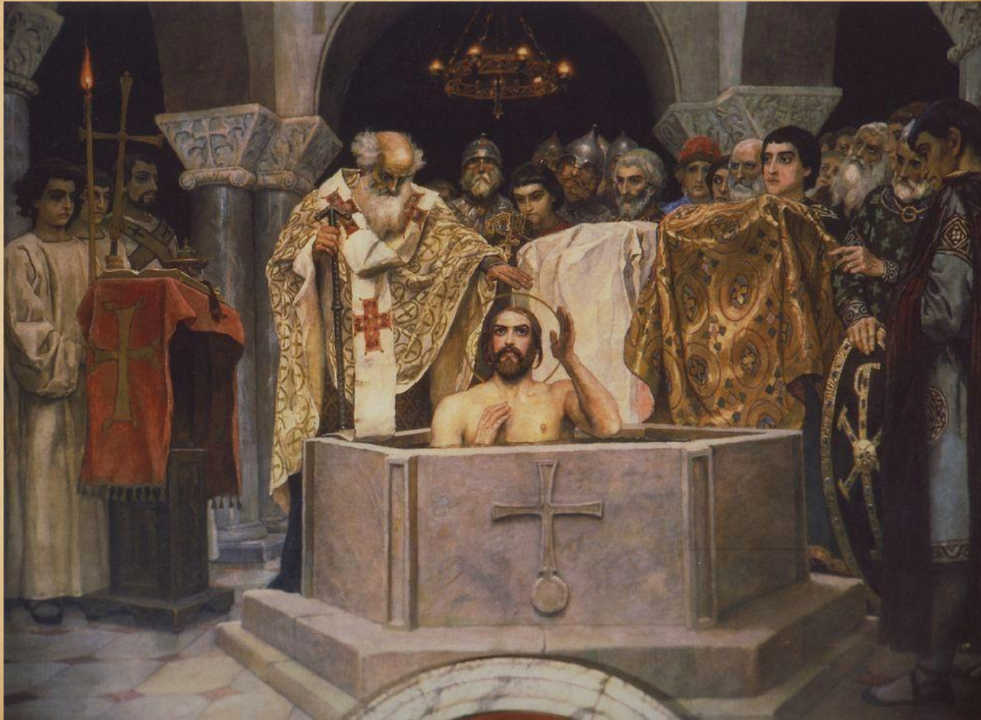
Крещение Владимира. Фреска В. М. Васнецова

Князь Владимир крестился. В Крещении князь принял имя Василий.