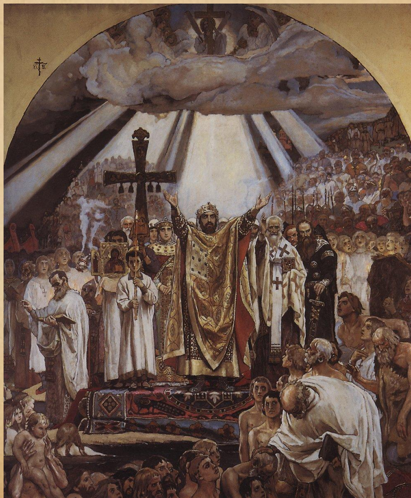
Крещение Руси. Фреска В. М. Васнецова

Жители Киева крестились в Днепре в 988 году. Потом крестилась вся Киевская Русь, а после и другие славянские племена.