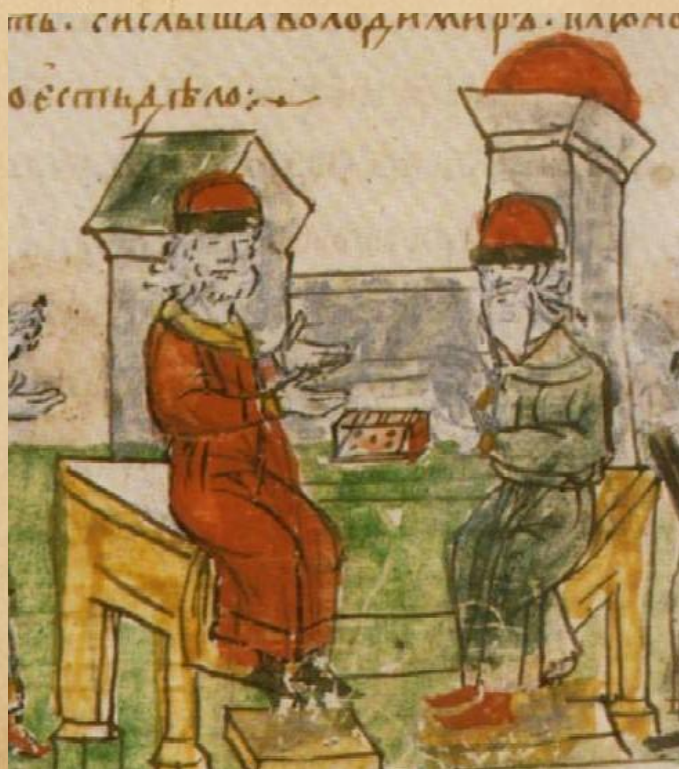
Беседа Владимира с греческим философом о христианстве

Князь Владимир часто слушал рассказы о том, как живут другие народы, чем они занимаются, каким поклоняются богам.