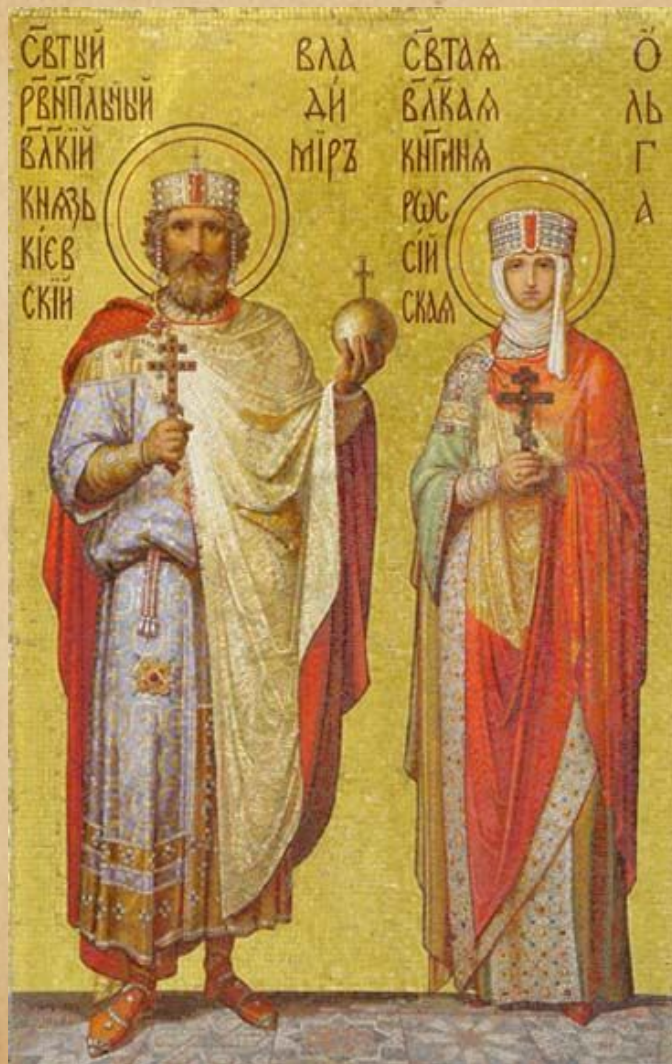
Равноапостольные Князь Владимир и княгиня Ольга Крестители