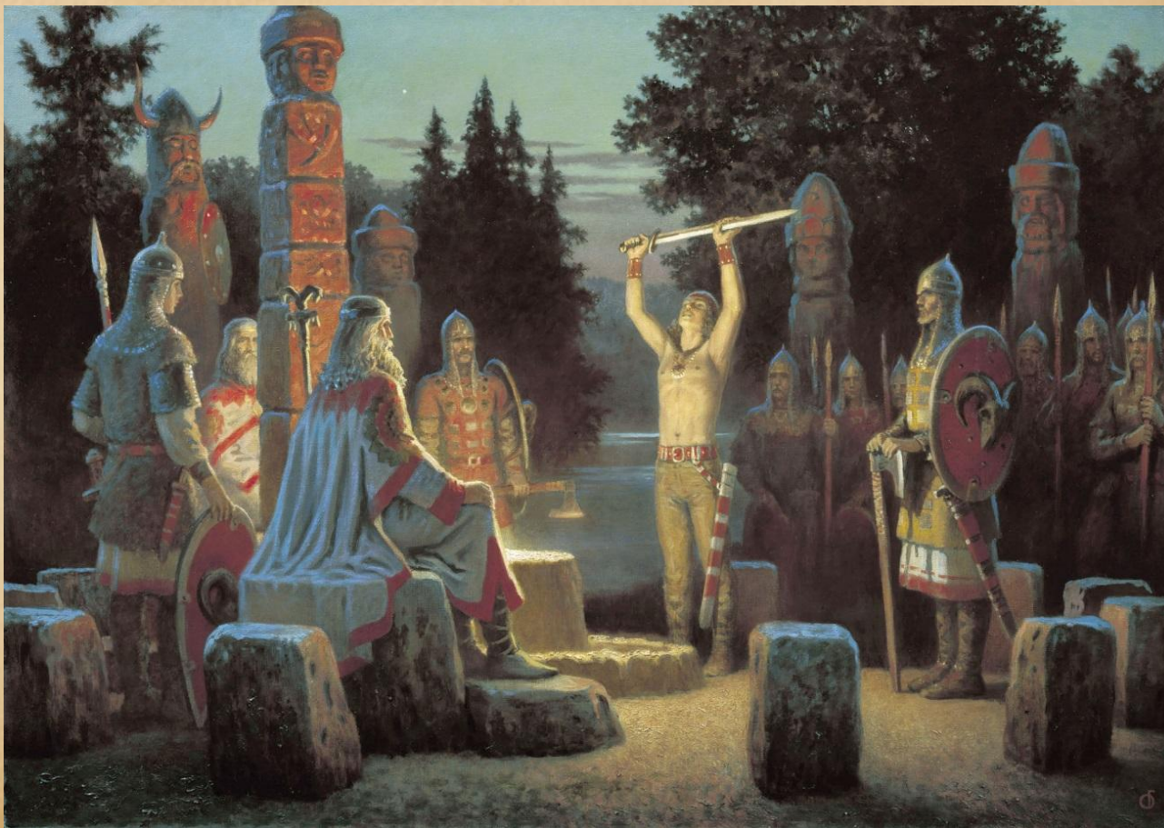
Борис Ольшанский. Клятва Сварожича

«И поклонялись люди им, нарицая их богами, и приводили сынов своих и дочерей, и приносили жертвы бесам...И осквернилась кровью земля Русская и холм тот», рассказывает летопись.