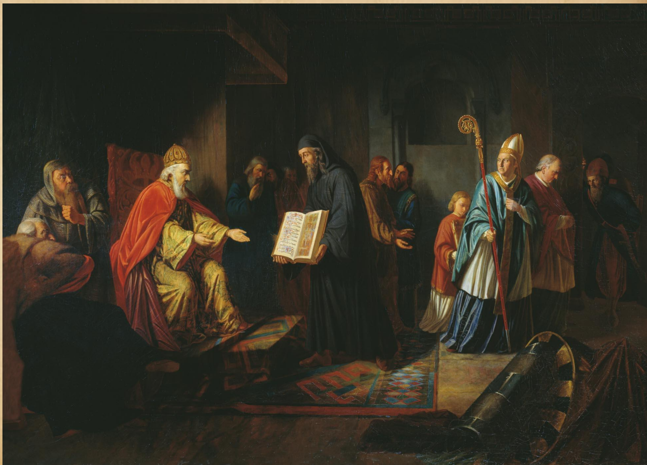
Великий князь Владимир избирает веру. И. Эггинк, 1822

Князю Владимиру больше всего понравилось христианство, о котором ему говорили греческие монахи.