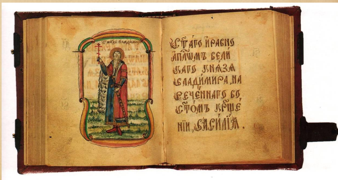
Повесть временных лет

На месте капищ стали строить христианские храмы. В Киеве, на том самом месте, где стоял знаменитый Перун, князь приказал построить храм Святого Василия. К концу правления князя Владимира в столице Руси - Киеве - уже было 400 храмов.