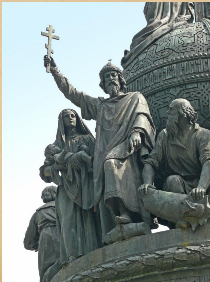
Владимир Святославович на памятнике «Тысячелетие России» в Великом Новгороде 1862 г.

Принятие христианства сыграло большую роль для развития русской культуры и русского государства. При святом князе Владимире Киевская Русь достигла расцвета и ее влияние распространилось далеко за ее пределы.