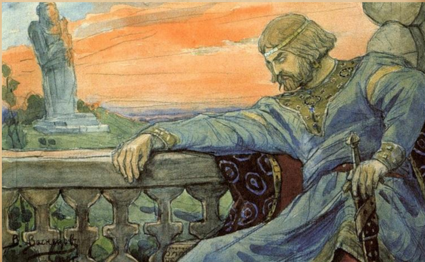
Владимир Васнецов. Владимир-язычник

Князь Владимир понимал, что славянские идолы - это только куски камня и дерева, и начал искать новую, правильную веру для себя и для своего народа.