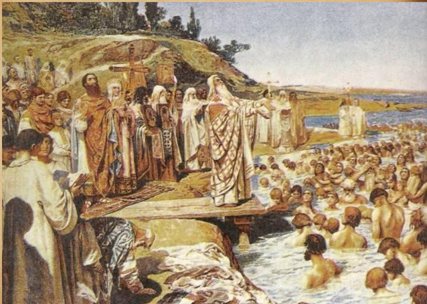
Лебедев Клавдий - Крещение Руси.