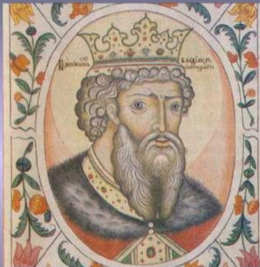
Владимир Святославович Красное Солнышко

Последние свои годы Ольга занималась воспитанием внука Владимира. Когда Владимир начал править, он был ярым язычником. Буйный нрав, много жён, убийство брата Ярополка, участие в человеческих жертвоприношениях – вот что пишут о нём летописи.