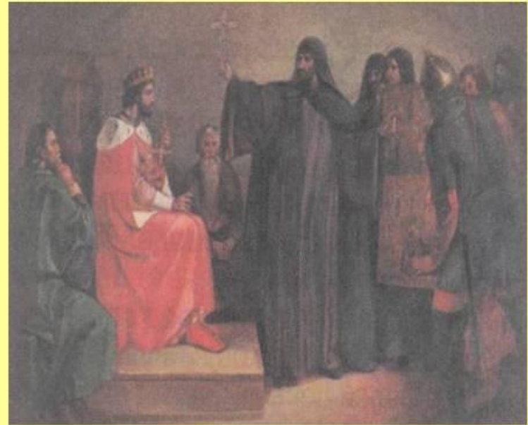
Выбор веры. Г.Иванов.(Копия картины Ф.Завьялова)

В летописи рассказывается, что к князю Владимиру приходили разные проповедники, расхваливая каждый свою веру. Первыми прибыли послы от волжских, или камских, болгар, принявших, как говорили на Руси, магометанство, или мусульманство, - религию, основателем которой был Магомет. В лето 986 пришли болгары магометанской веры, говоря: "...Уверуй в закон наш и поклонись Магомету... Учит нас Магомет так: ...не есть свинины, вина не пить... Даст Магомет каждому по семидесяти прекрасных жён..." Мусульманская вера отпугнула Владимира запретом есть свинину и пить вино "Руси есть веселие пить, не можем без того быть".