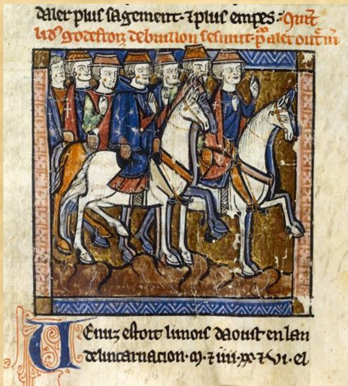
Отбытие крестоносцев из Европы

Осенью 1096 в путь двинулось рыцарское ополчение из разных частей Европы, вождями его были Готфрид Бульонский, Раймунд Тулузский и др. К концу 1096 — началу 1097 они собрались в Константинополе, весной 1097 переправились в Малую Азию, где совместно с византийскими войсками начали осаду Никеи, взяли ее 19 июня и передали византийцам.