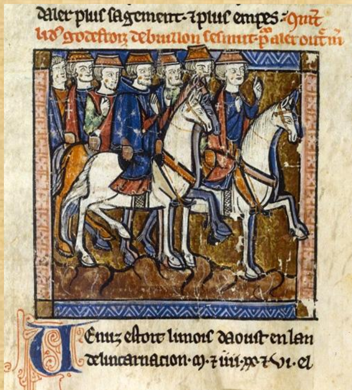
Отбытие крестоносцев из Европы

Осенью 1096 в путь двинулось рыцарское ополчение из разных частей Европы, вождями его были Готфрид Бульонский, Раймунд Тулузский и др. К концу 1096 — началу 1097 они собрались в Константинополе, весной 1097 переправились в Малую Азию, где совместно с византийскими войсками начали осаду Никеи, взяли ее 19 июня и передали византийцам.