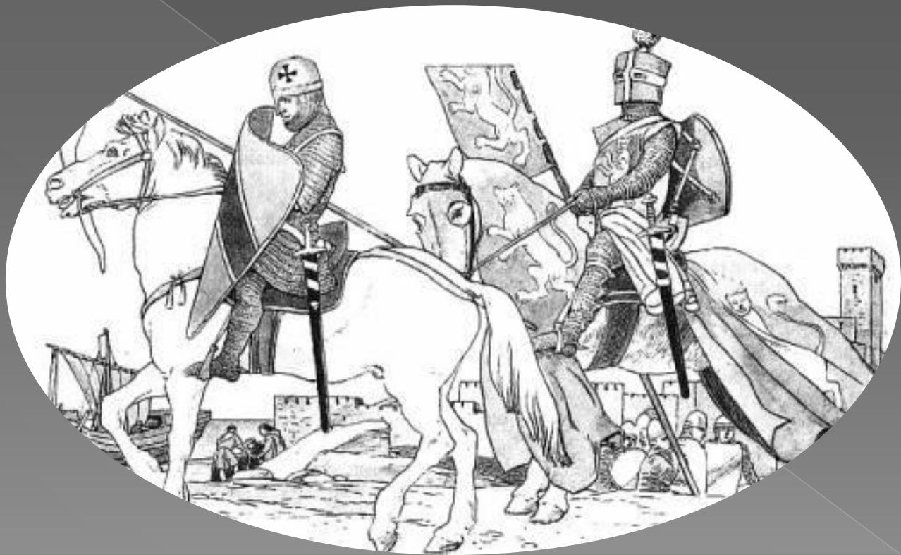
приблизительно с 1250 по 1270гг.