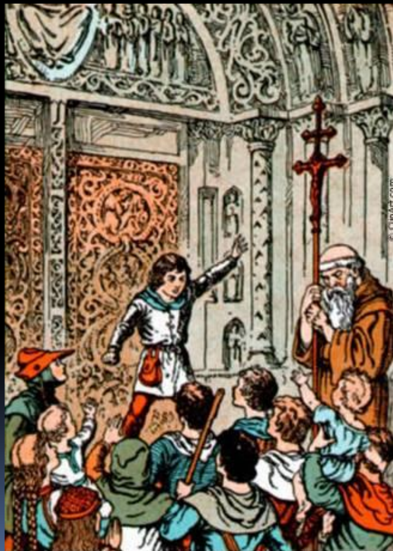
Child Preaching the Children's Crusade