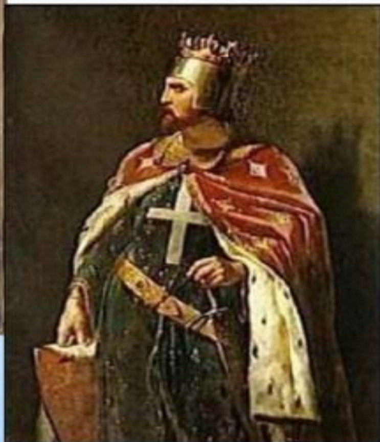
Ричард I Львиное Сердце – английский король