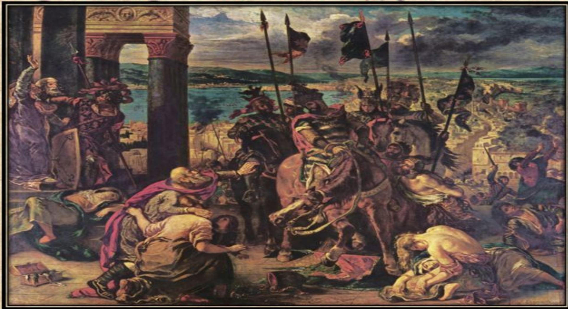
Эжен Делакруа. Вступление крестоносцев в Константинополь (1840)