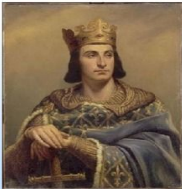
Филипп II Август – французский король