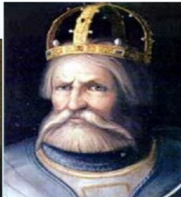
Фридрих I Барбаросса – немецкий король