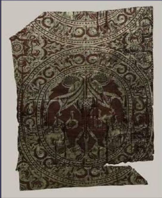
Шелковая ткань. Испания