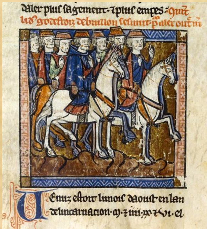
Отбытие крестоносцев из Европы

Осенью 1096 в путь двинулось рыцарское ополчение из разных частей Европы, вождями его были Готфрид Бульонский, Раймунд Тулузский и др. К концу 1096 — началу 1097 они собрались в Константинополе, весной 1097 переправились в Малую Азию, где совместно с византийскими войсками начали осаду Никеи, взяли ее 19 июня и передали византийцам.