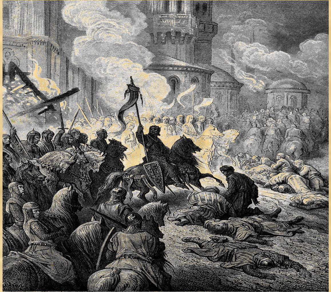
50. Entry of the Crusaders into Constantinople The Crusaders invade Constantinople, killing everyone they encounter, setting fire to the city and frightening the Greeks into retreating.