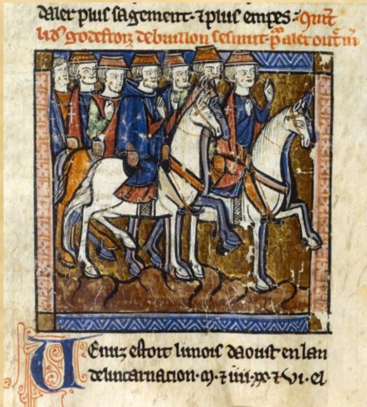
Отбытие крестоносцев из Европы

Осенью 1096 в путь двинулось рыцарское ополчение из разных частей Европы, вождями его были Готфрид Бульонский, Раймунд Тулузский и др. К концу 1096 — началу 1097 они собрались в Константинополе, весной 1097 переправились в Малую Азию, где совместно с византийскими войсками начали осаду Никеи, взяли ее 19 июня и передали византийцам.