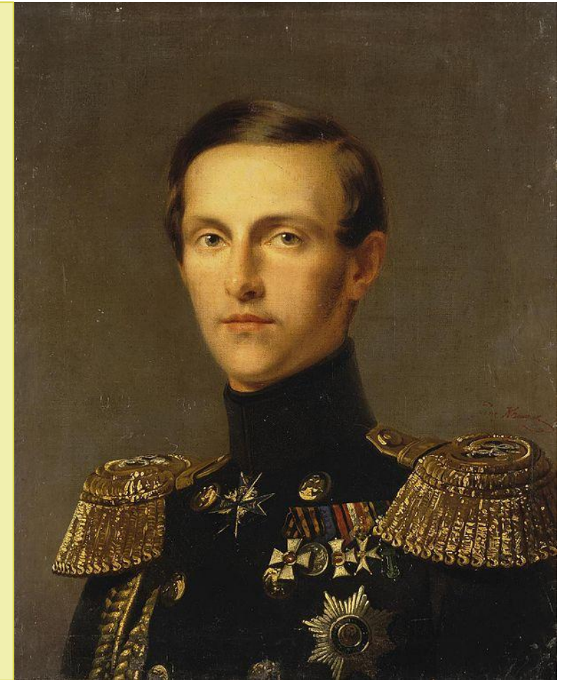
Константин Николаевич (великий князь)