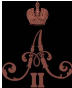
Константин Николаевич (великий князь)