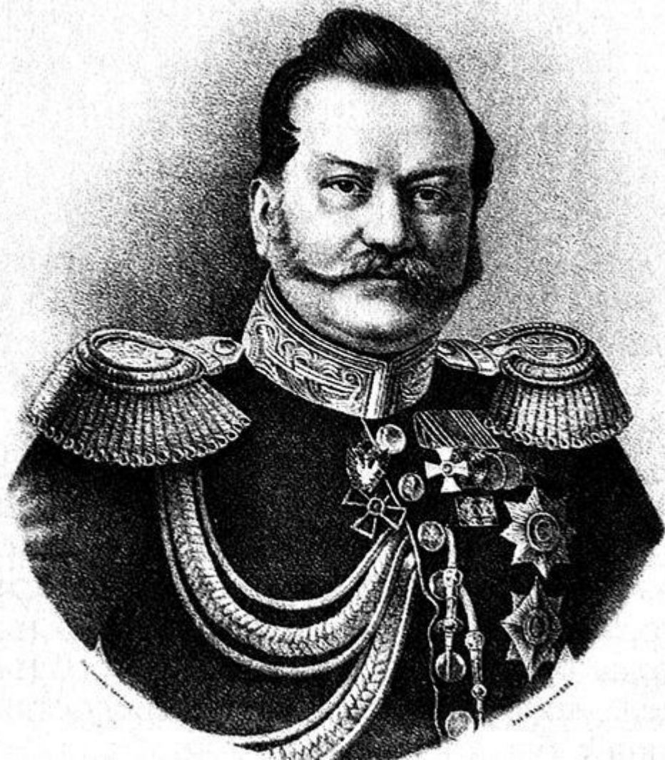
Я. И. Ростовцев

«Изначально был противником отмены К.П., но начав свою работу с главным комитете по решению крестьянского вопроса изменил СВОЮ ПОЗИЦИЮ».