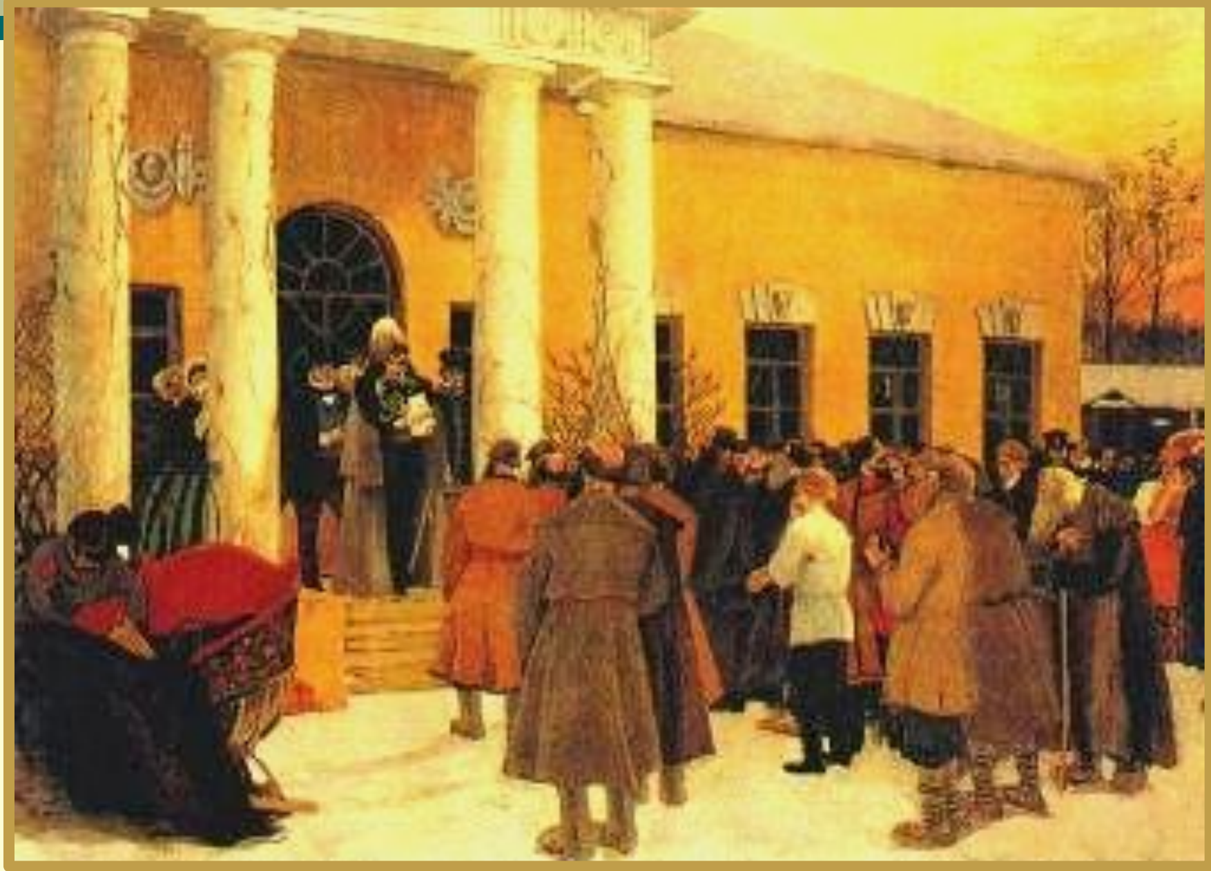
Б. Кустодиев «Освобождение крестьян»