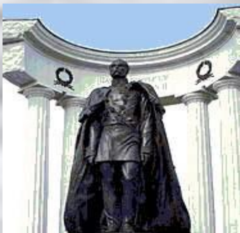
Памятник в Москве АЛЕКСАНДР II