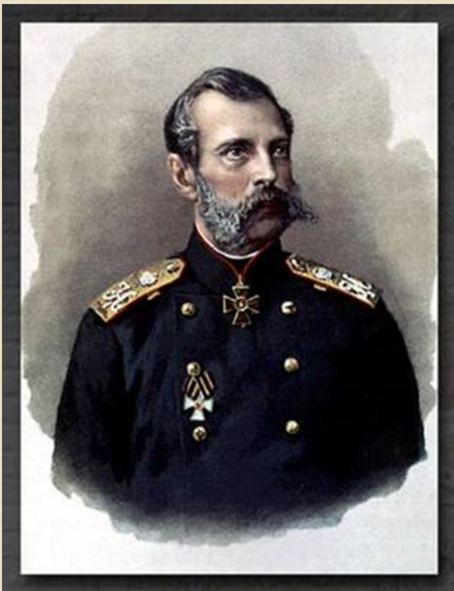
Александр II (1855-1881)

«Лучше начать уничтожение крепостного права сверху, нежели ждать, когда оно начнет уничтожаться снизу»