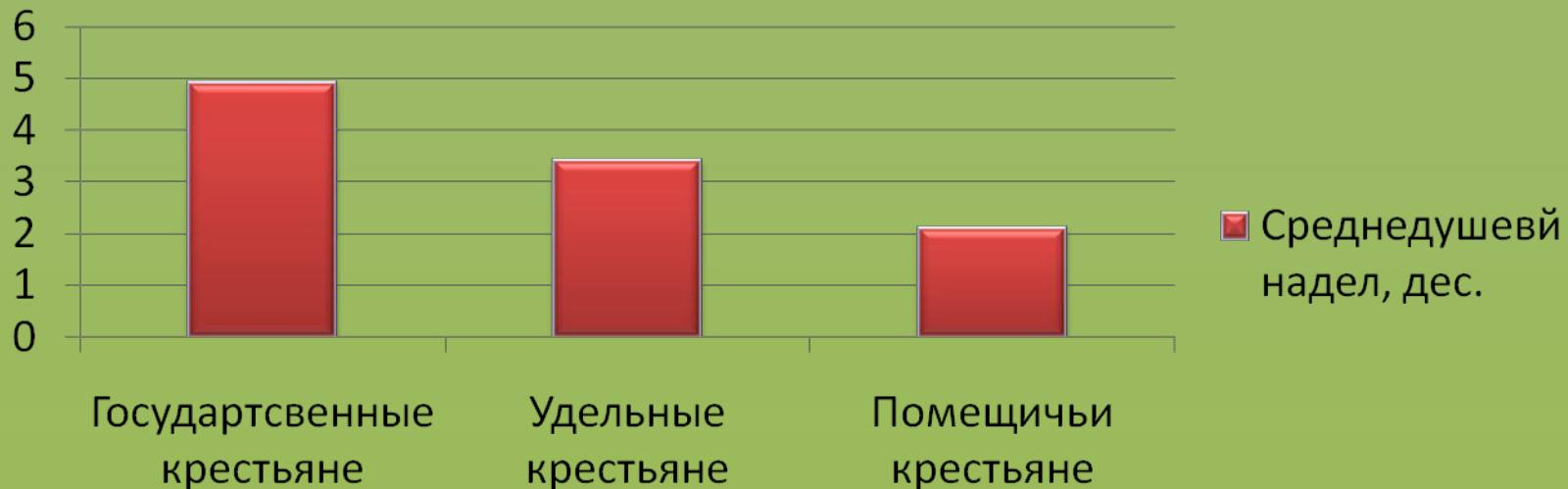
Среднедушевой надел, дес.