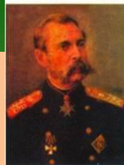
Император (1855–1881) Александр II