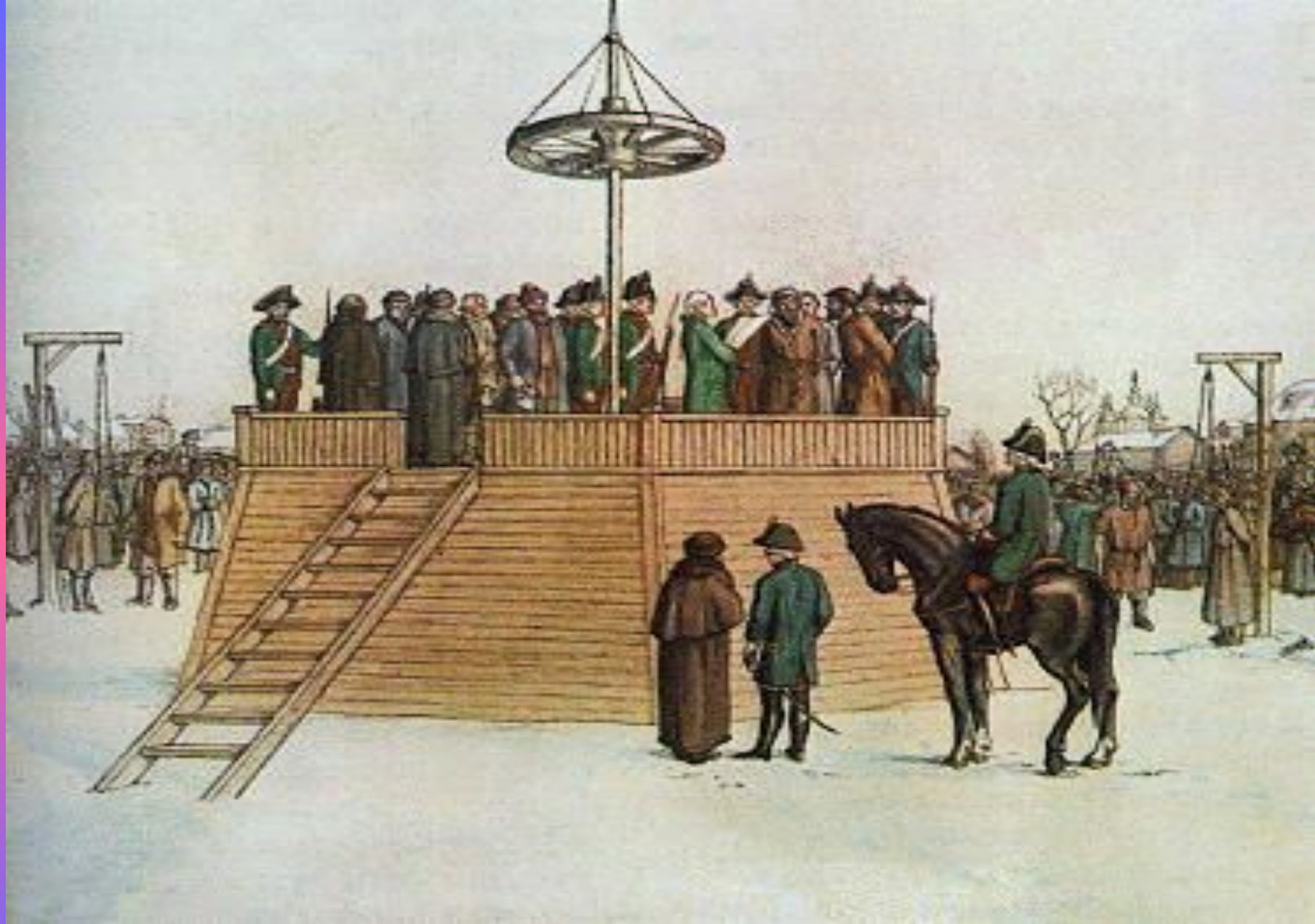
Казнь Пугачева и его соратников в Москве